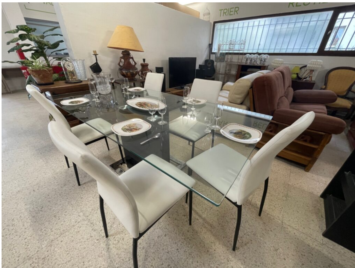
Un mobilier en parfait état