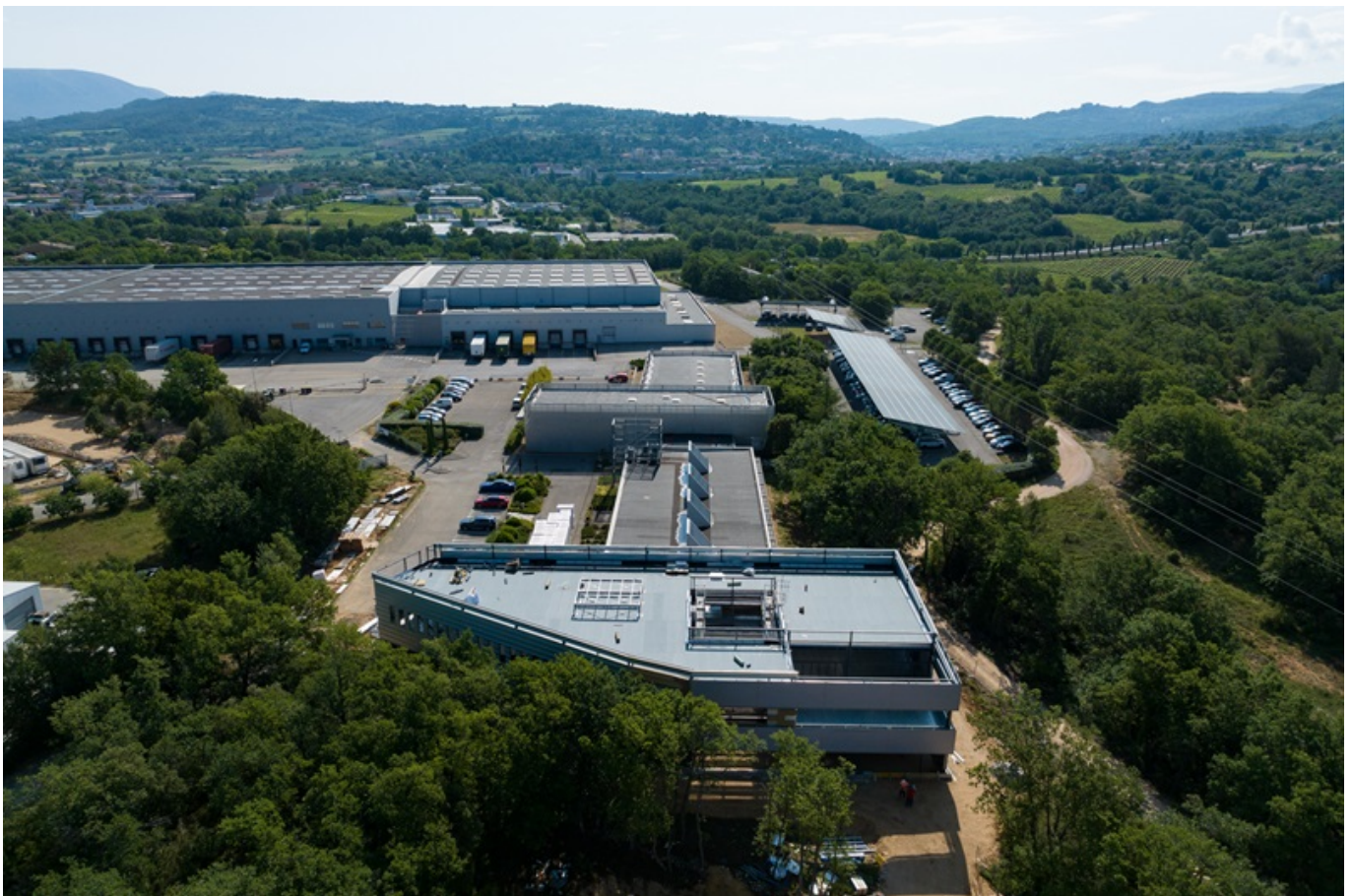
Le nouveau bâtiment est en bas de la photo.