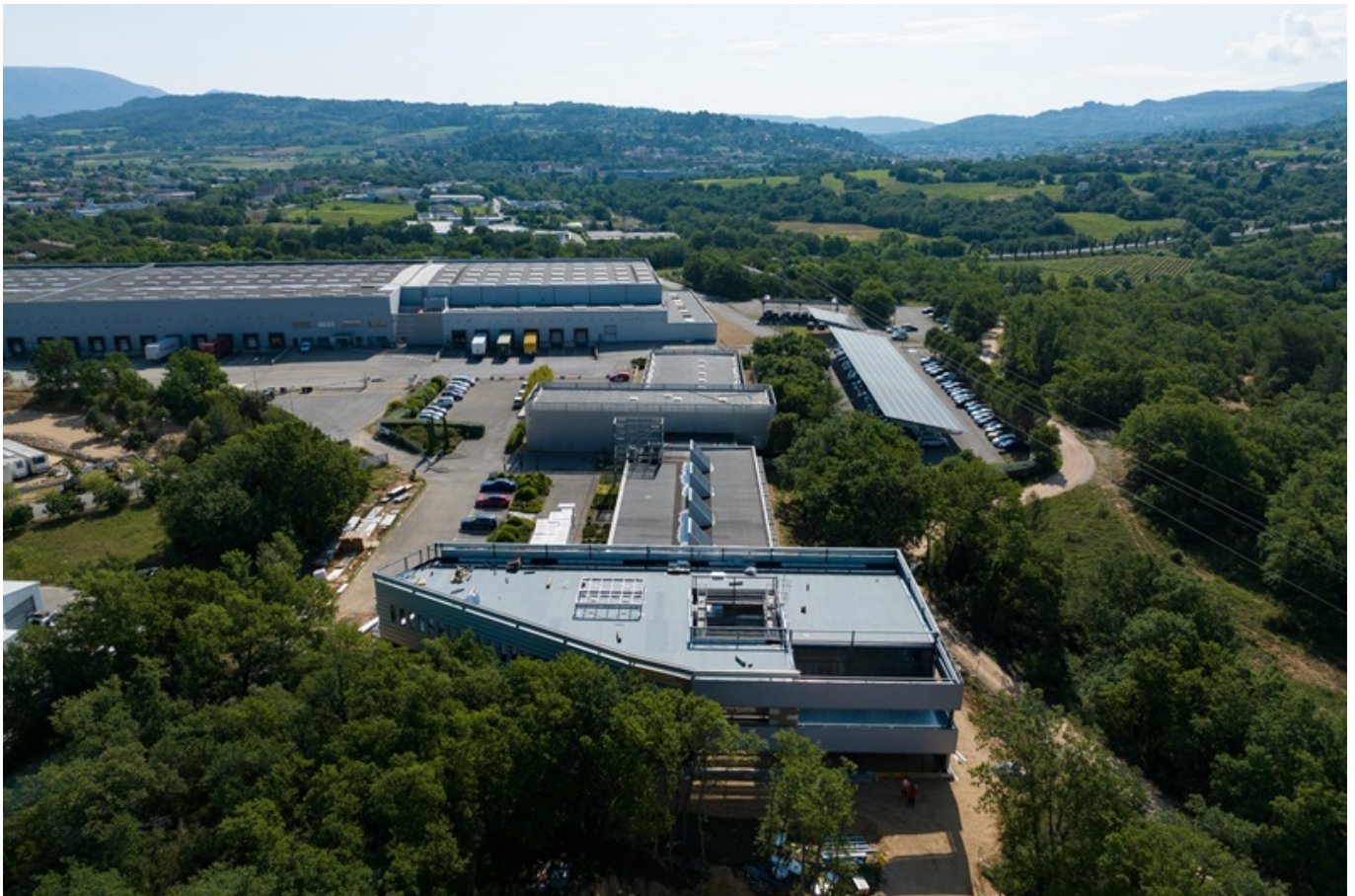
Le nouveau bâtiment est en bas de la photo.