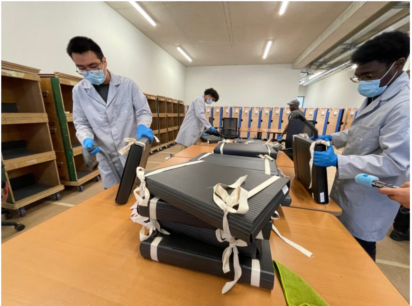
Le dépoussiérage

Elle s'est faite dès 2017 avec l'inventaire et le reconditionnement des premiers documents dans des boîtes. Les premiers reconditionnements et dépoussiérages ont été réalisés par la société FFAS , tout en effectuant un récolement détaillé : nature du document, référencement, cote et géolocalisation dans le palais. Les boîtes balisées -les balises sont une feuille de couleur qui indique les boîtes à prendre- sont ensuite insérées dans une Jeannette, armoire roulante en bois faites sur mesure pour pouvoir rouler dans les allées du palais et être insérées dans un camion ou une camionnette sous scellés. C'est là qu'intervient la société Avizo qui assure le déplacement et un second dépoussiérage. Les Jeannettes sont ensuite déchargées et les boîtes dépoussiérées avant d'être déplacées, par le déménageur, dans son magasin définitif. Chaque document est ensuite entré en fichier informatique pour situer son nouvel emplacement.