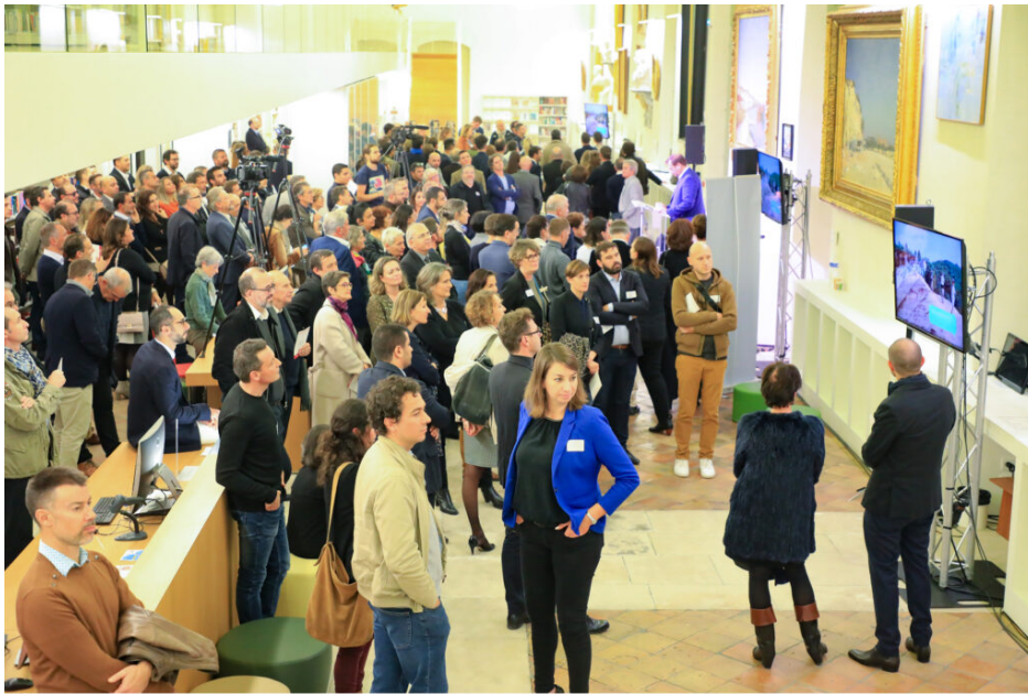
Plus de 200 décideurs locaux étaient réunis à l'Inguimbertaine

graines, des semences, des producteurs de fruits, de légumes, d'herbes aromatiques, des transformateurs, des entreprises d'agro-alimentaire, des centaines d'ingénieurs et de chercheurs en agronomie, une chambre d'agriculture, une université, des paysans, un pôle de compétitivité Innov'Alliance , nous pouvons mutualiser nos laboratoires et aller bien plus loin« .