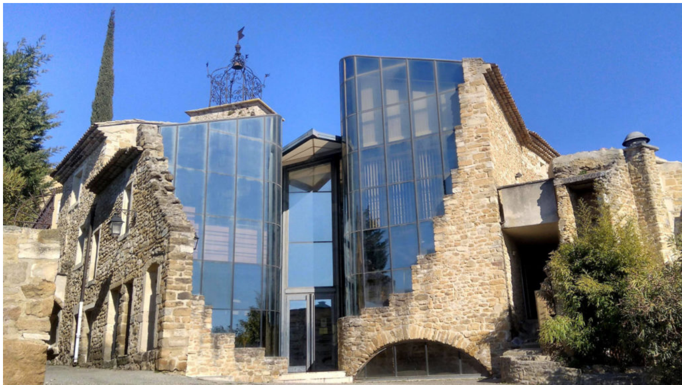
Maison Milon.