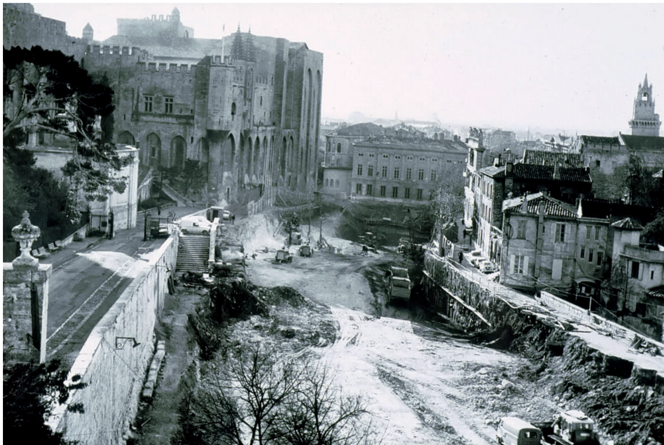
La construction du parking du palais des papes.