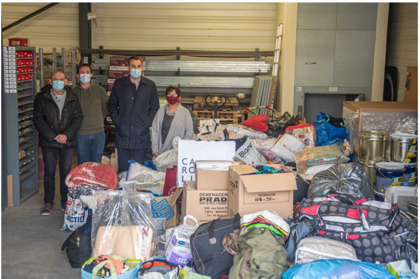
Collecte dans la ville de Bollène en présence du maire.

Chaque commune a sa propre organisation et ses propres lieux et horaires, merci de vous rapprocher des municipalités concernées.