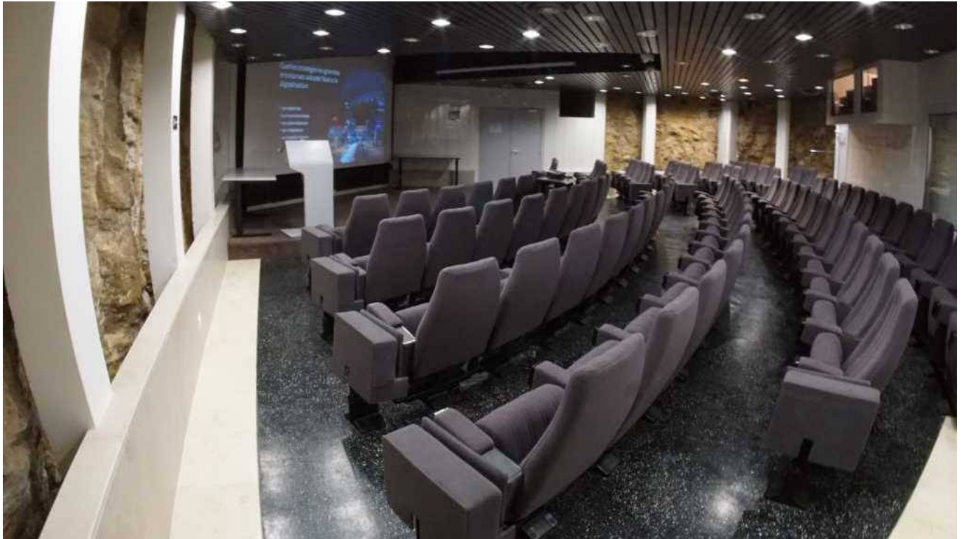
Amphithéâtre, campus Haut Provence.