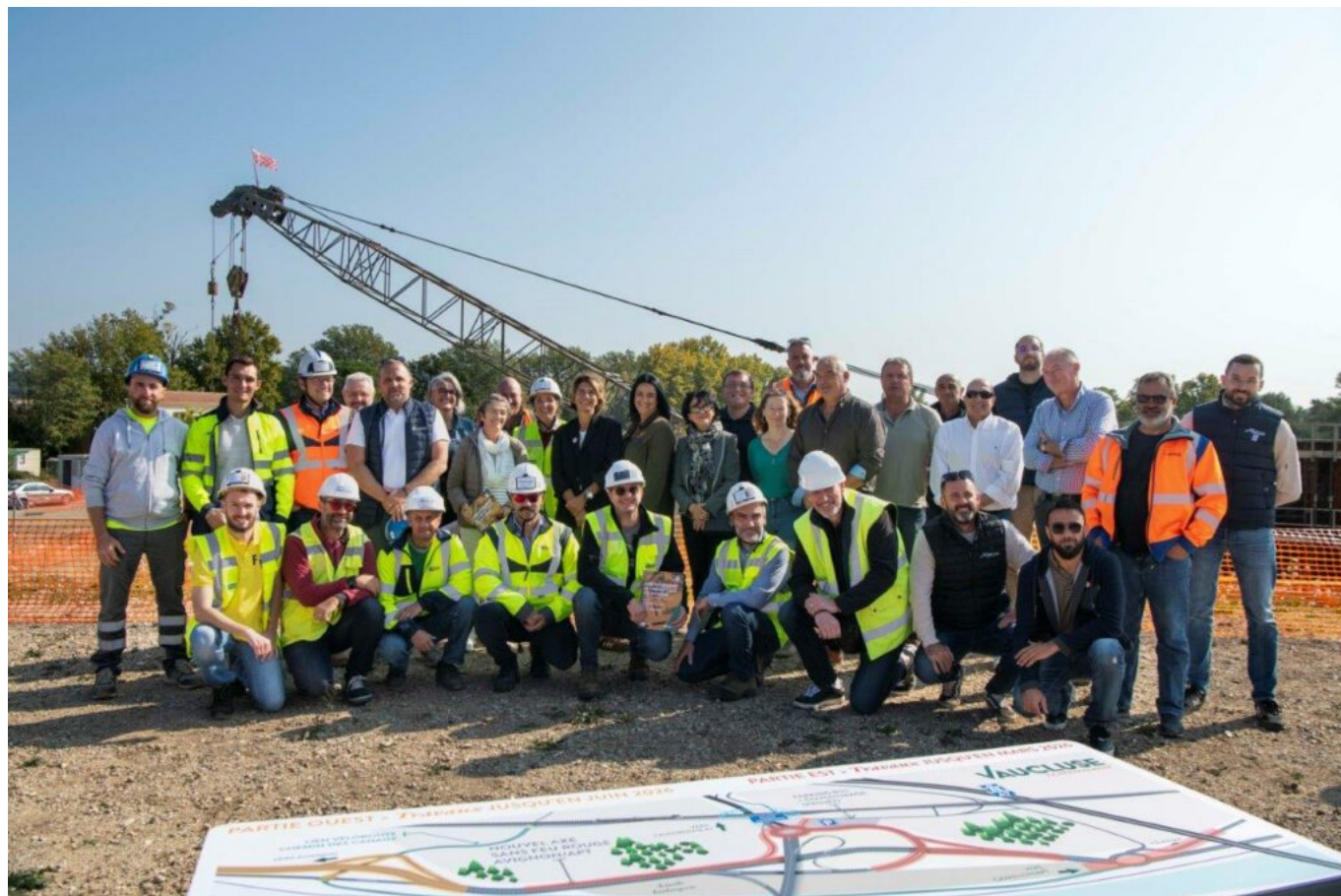
Une visite du chantier a été organisée ce mercredi 14 octobre.

Ce nouveau giratoire devrait être mis en service à la fin de l'année et des modifications de circulation seront aussi mises en place au travers de deux voies provisoires à la sortie de l'autoroute vers les Bouches-du-Rhône et à la sortie de l'autoroute vers Avignon. Tous les accès au péage d'Avignon Sud se feront à partir du nouveau carrefour giratoire.