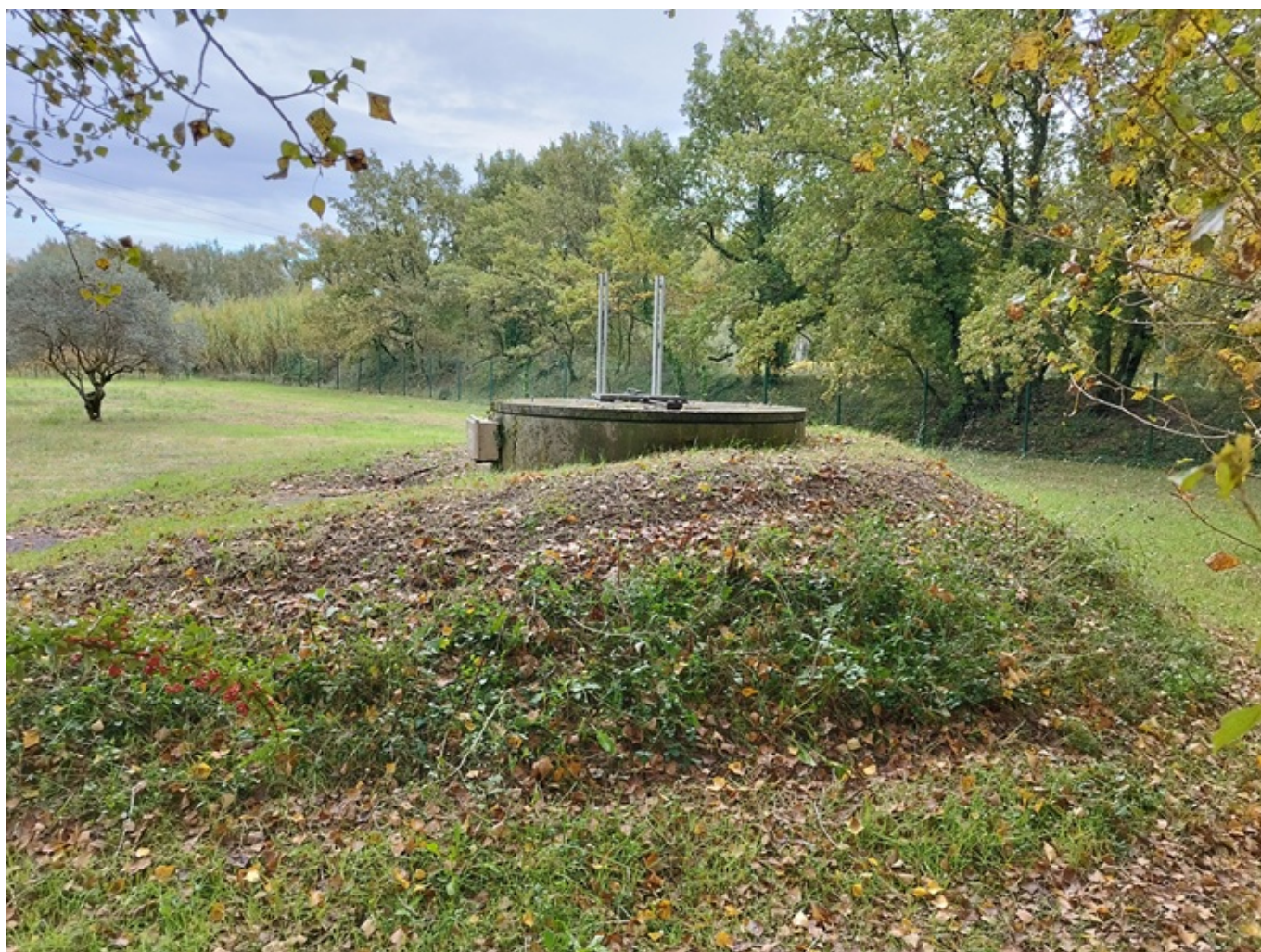
Le point de captage de Grès de Meyras à Aubignan, appartenant au Syndicat Rhône-Ventoux comporte deux forages

Pour connaître en temps réel les niveaux d'eau de la nappe du miocène, le Département a mis en place des sondes de mesures de niveau d'eau. Il y en a 19 actuellement avec pour objectif d'en avoir 30 à terme. Ce maillage du territoire avec ces sondes installées permettra de définir l'évolution de la nappe dans le temps. Elles sont présentes sur des lieux divers comme le point captage de Grès de Meyras à Aubignan, appartenant au Syndicat des eaux Rhône Ventoux , avec deux forages.