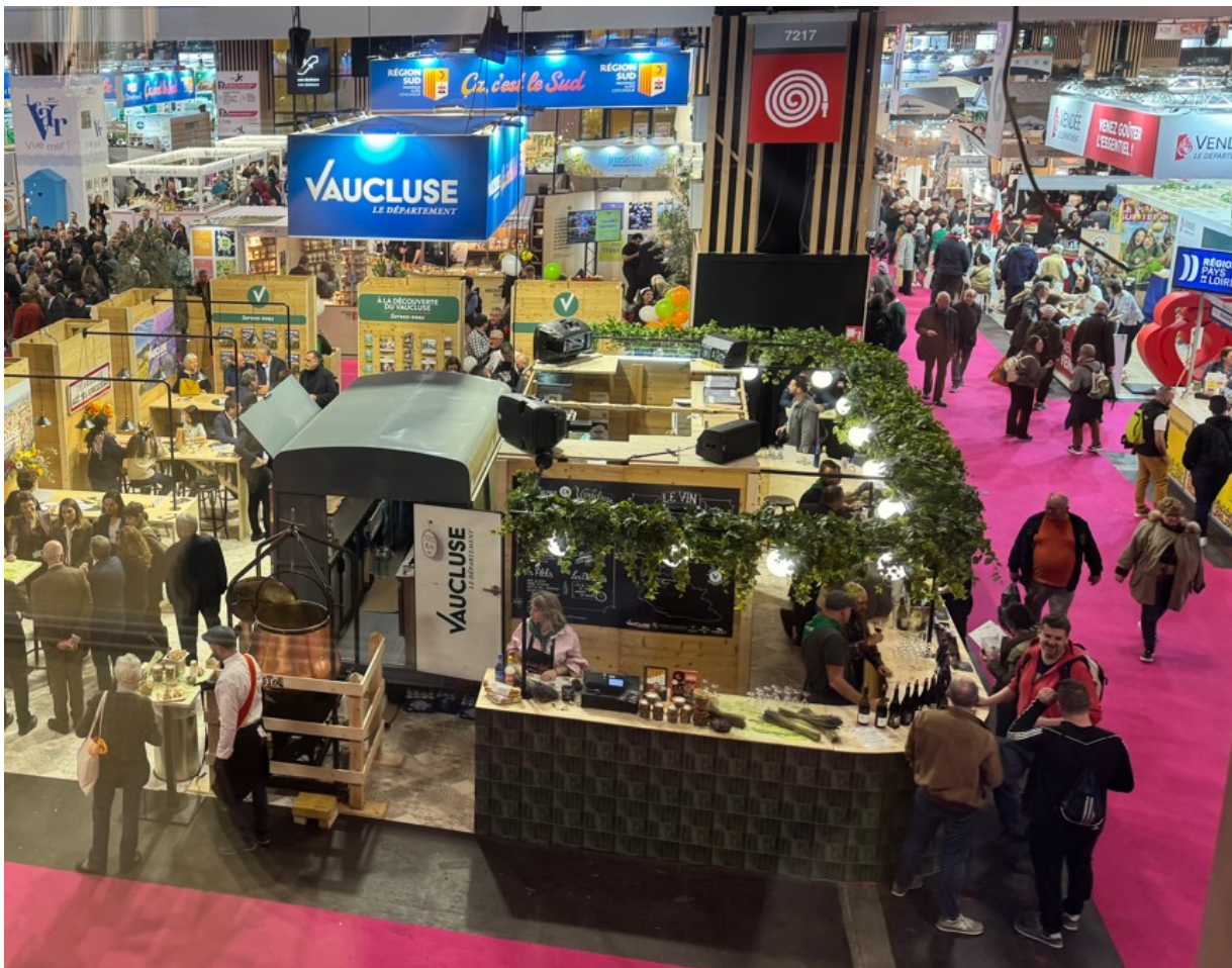
Le Stand du Vaucluse.

Côté vignoble, ce sont les appellations des vignerons de Plan-de-Dieu, Sablet, Massif d'Uchaux et Sainte-Cécile-les-Vignes qui se sont partagées l'animation des dégustations du bar à vin de l'espace Vaucluse.