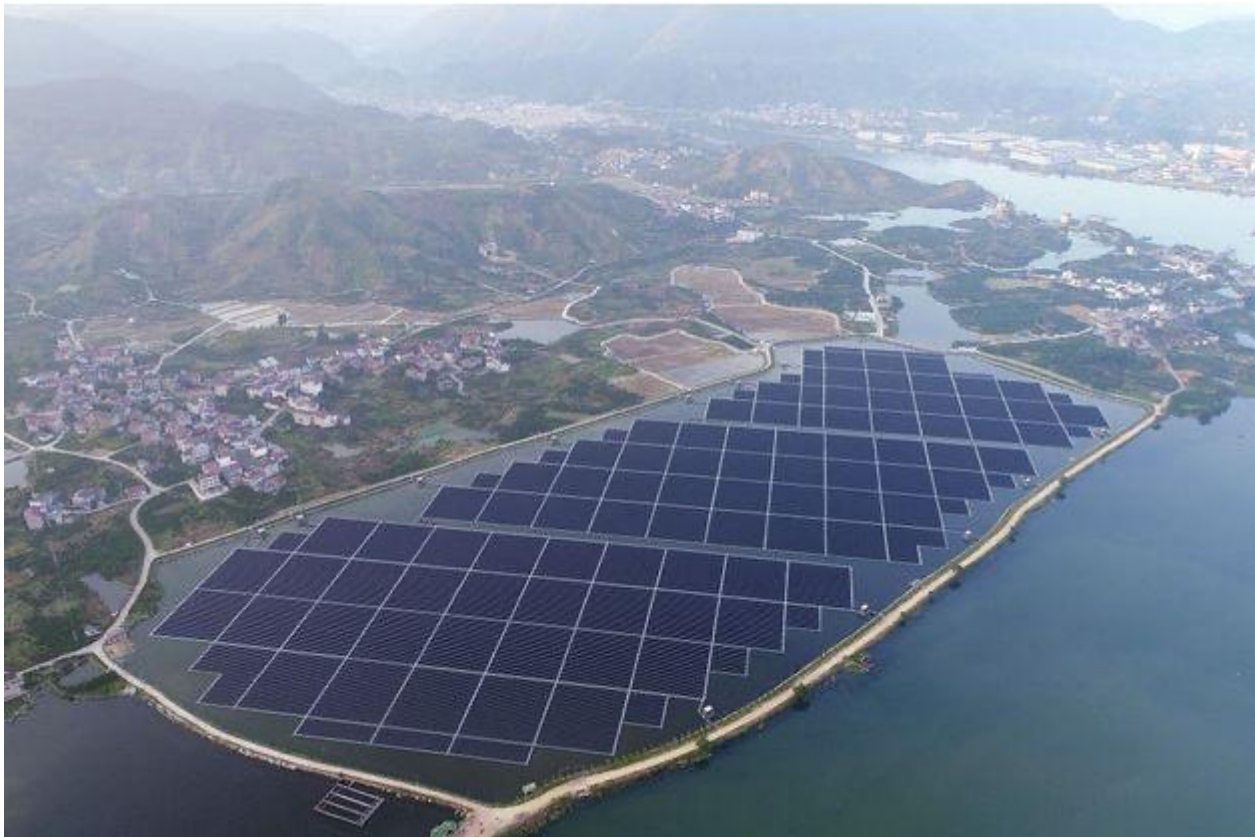
Centrale solaire flottante de Piolenc.

Concernant l'éolien, il est très peu développé en Provence, en raison de la présence de plusieurs bases aériennes (Salon, Istres, Orange).