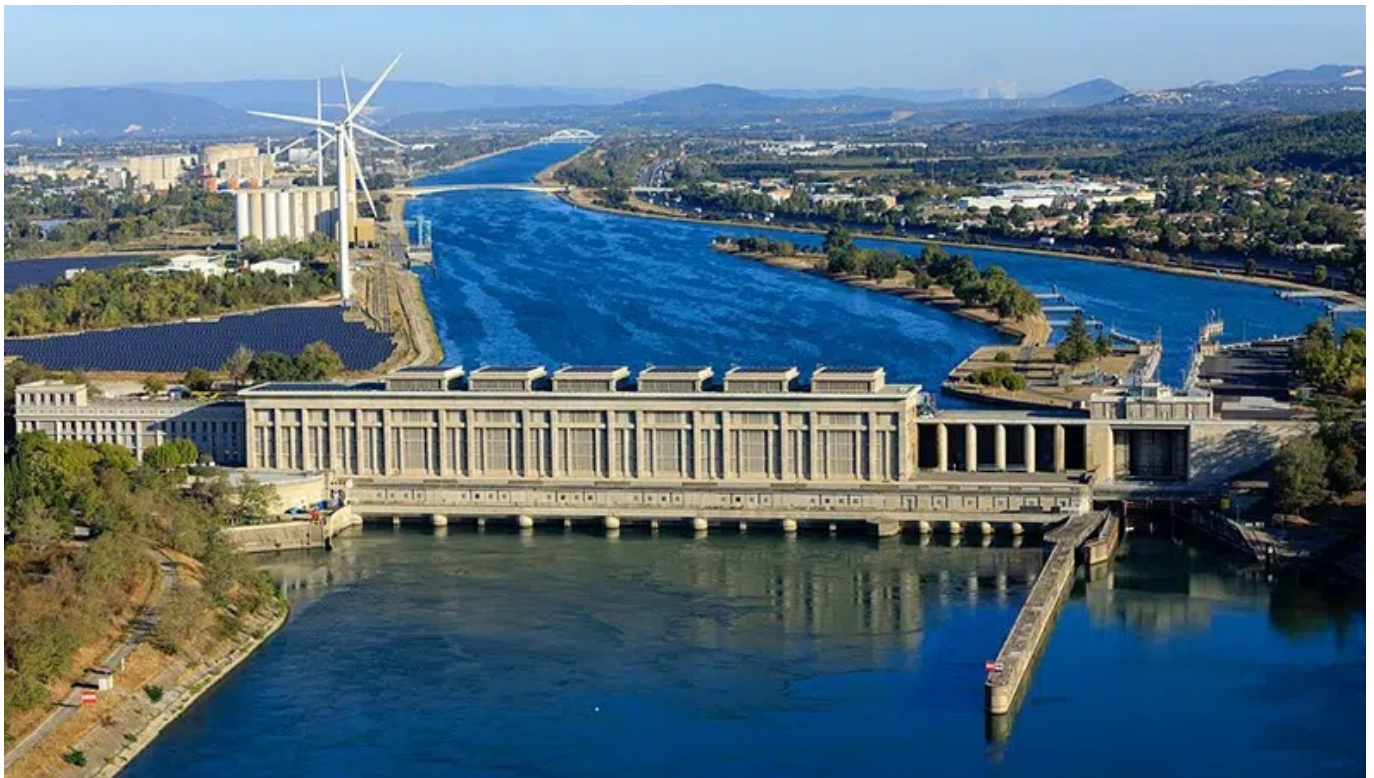
Centrale hydroélectrique de Bollène .

Dans le Vaucluse, l'hydroélectricité représente aujourd'hui 84% de la production d'énergie verte et le photovoltaïque 11% (source : Enedis). Le plus gros site de production d'électricité hydraulique est installé au niveau de la commune de Bollène, sur un canal parallèle au Rhône (barrage de Donzère-Montdragon). Il a été inauguré par Vincent Auriol en 1952, c'est-à-dire une éternité ! Il a fallu attendre 2019 pour qu'un autre projet d'envergure utilisant des énergies renouvelables soit mis en œuvre. Il s'agit de la centrale photovoltaïque flottante de Piolenc, avec ses 47 000 panneaux (soit 22 hectares), elle fût un temps la plus grande d'Europe.