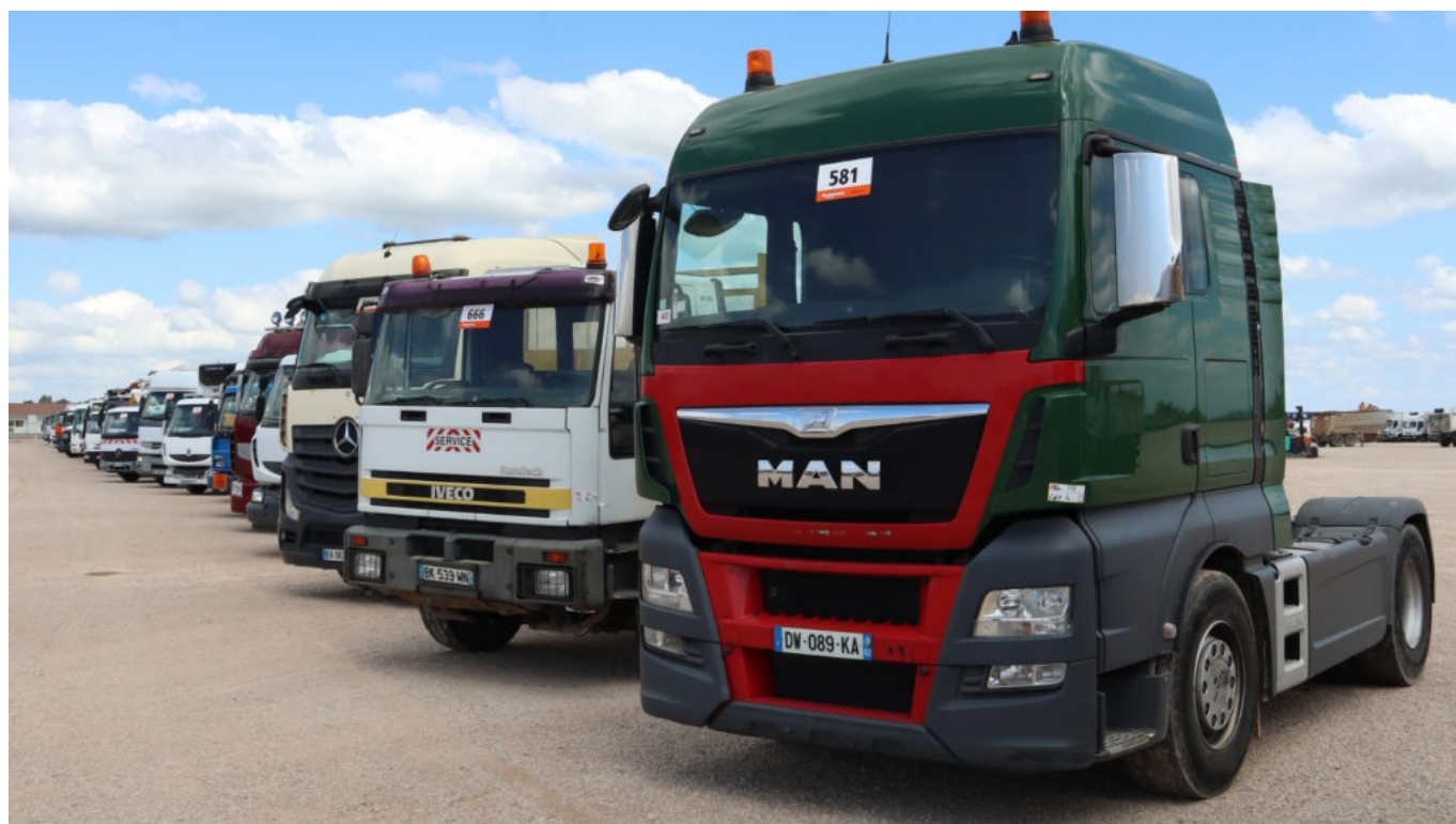
Parc de gestion à Avignon.

En 2021, pour pallier la distance induite par le digital, Ritchie Bros souhaite se rapprocher de ses clients en renforçant sa présence sur le territoire national. grâce à ses 4 sites en France. L'entreprise souhaite ouvrir prochainement de nouveaux sites satellites pour homogénéiser son maillage sur le territoire. « Au-delà du lien régional entre le commercial et ses clients, l'ouverture de nouveaux sites en France permet une diminution des coûts de transport. Chaque vendeur entretient une relation particulière avec son commercial qui lui est rattaché. Le commercial conseille son vendeur en mettant à profit son expertise et sa connaissance du marché pour déterminer la valeur de l'équipement mis en vente ». Afin d'accompagner encore mieux ses clients, Ritchie Bros souhaite renforcer ses équipes commerciales. Aujourd'hui composée de 7 commerciaux, l'équipe recrute de nouveaux collaborateurs au Nord-Est et au secteur agricole.