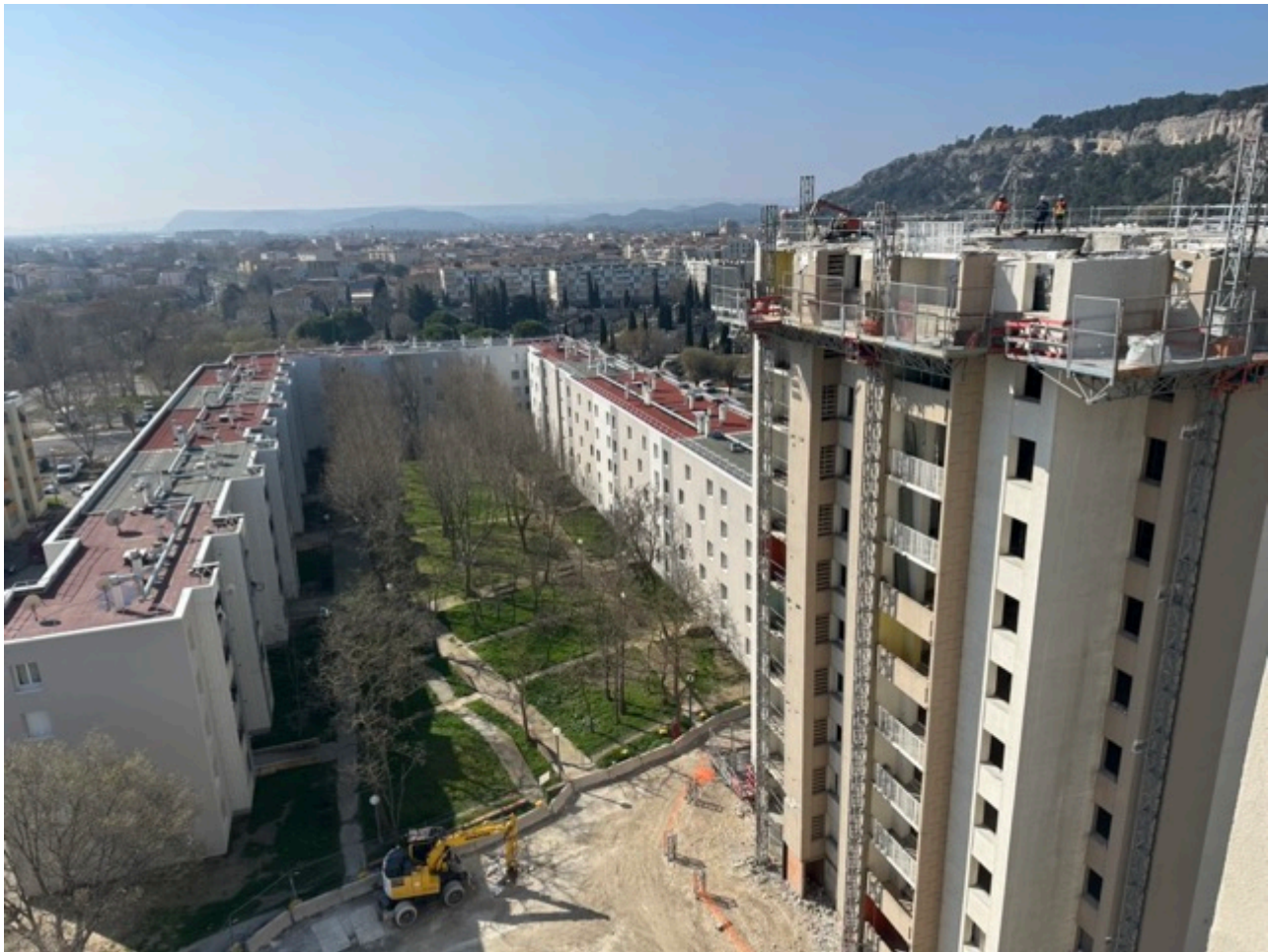
La Tour N vue depuis le 12e étage de la Tour D.