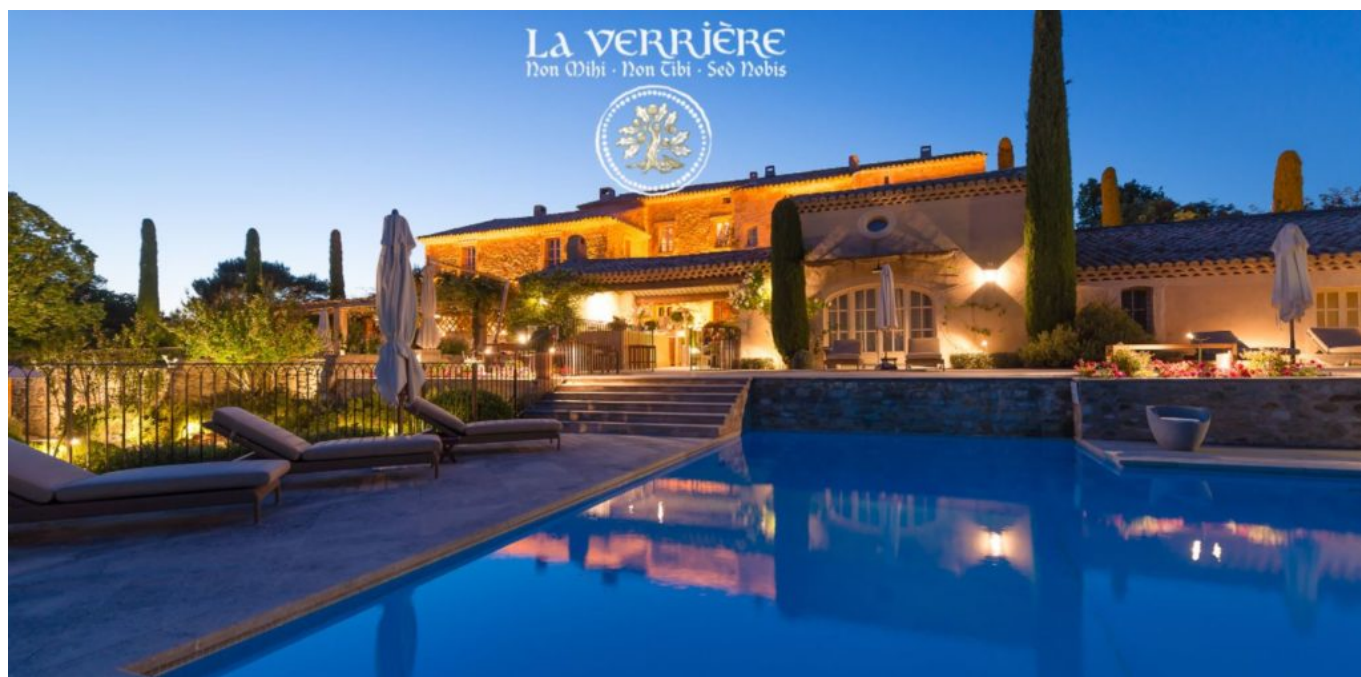
Le crépuscule des Dieux. @La Verrière

navigue entre les croyances ancrées du Moyen Âge, le taureau Vintur, Dieu du mal qui récolte les sacrifices humains (à l'origine du Mont Ventoux), la déesse Vaison et toute la symbolique de fertilité autour de la nature. Installé confortablement, son regard au loin se laisse transporter, animé d'une sagesse réconfortante. L'aura émanant de l'ancienne bastide du XVIII e est mystique.