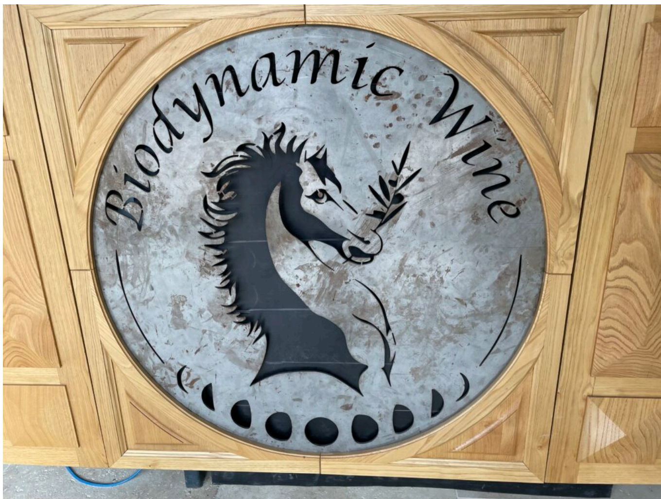
Le blason de Biodynamic Wine le Domaine des carabiniers à Roquemaure