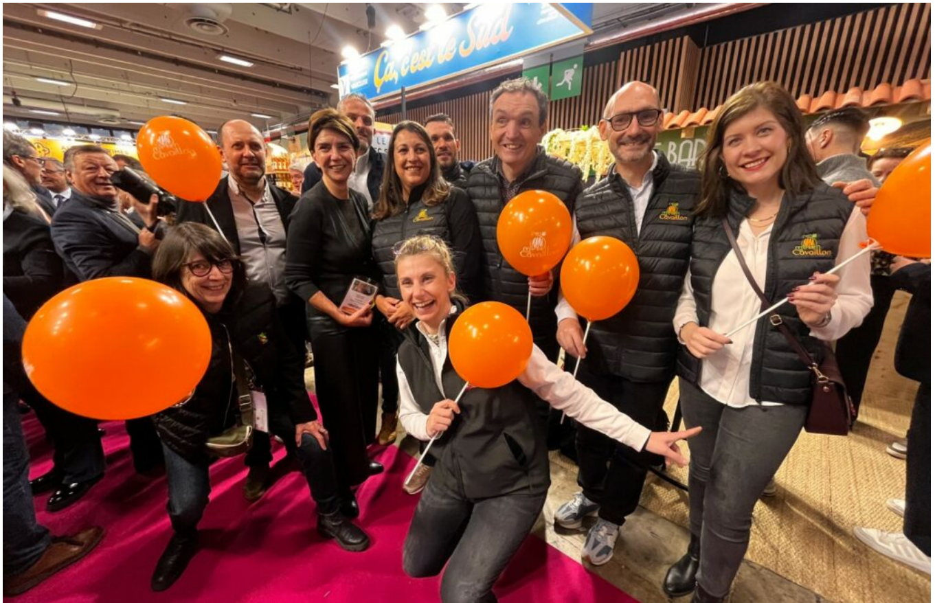
La présidente du Conseil départementale de Vaucluse avec les producteurs de melon de Cavaillon.

« Grâce à l'agriculture et à la viticulture, nous avons de magnifiques paysages qui attirent les touristes du monde entier. »