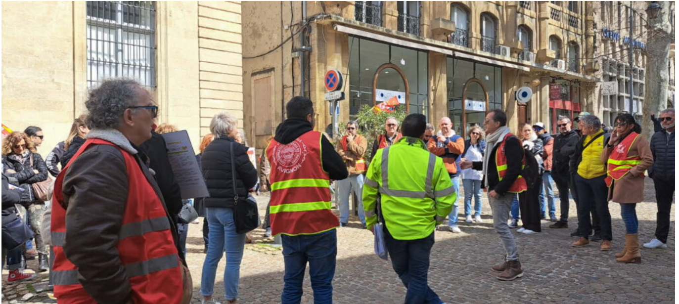
Un appel à une manifestation inter-syndicale et unitaire a été lancé pour le 3 avril à Avignon