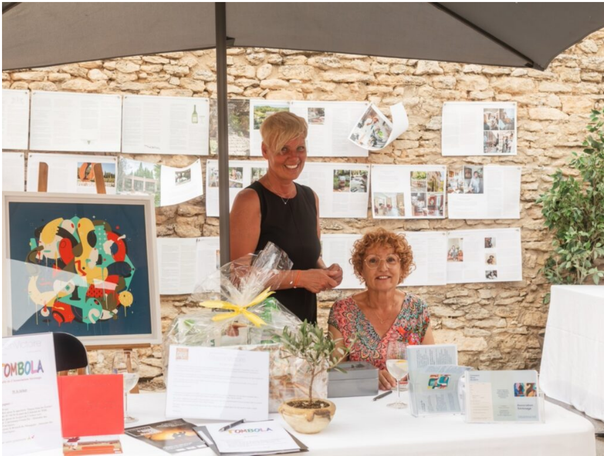
L'association SErEn'Âge.