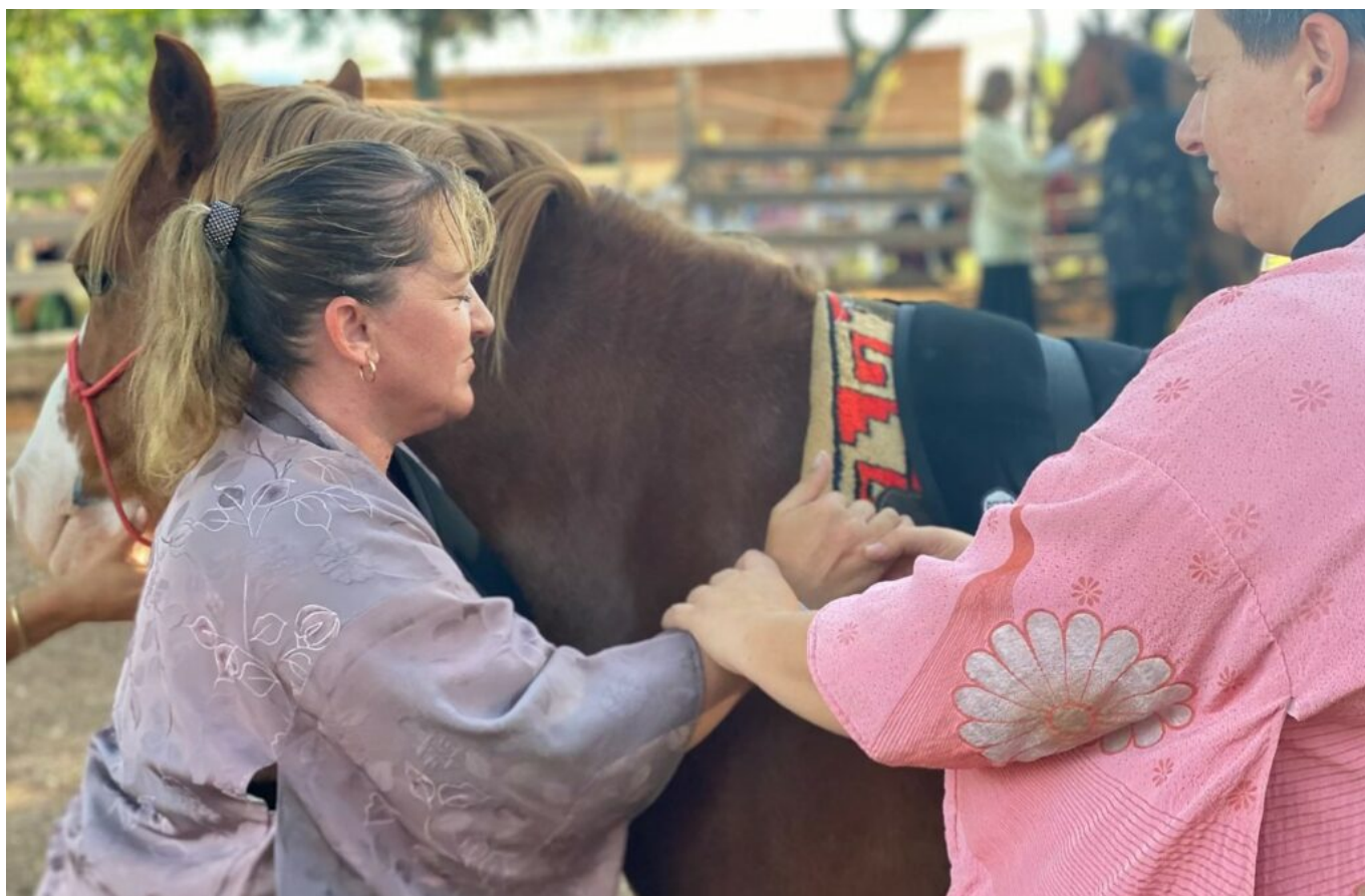
Accompagnement de femmes lors d'un atelier d'équihomologie.