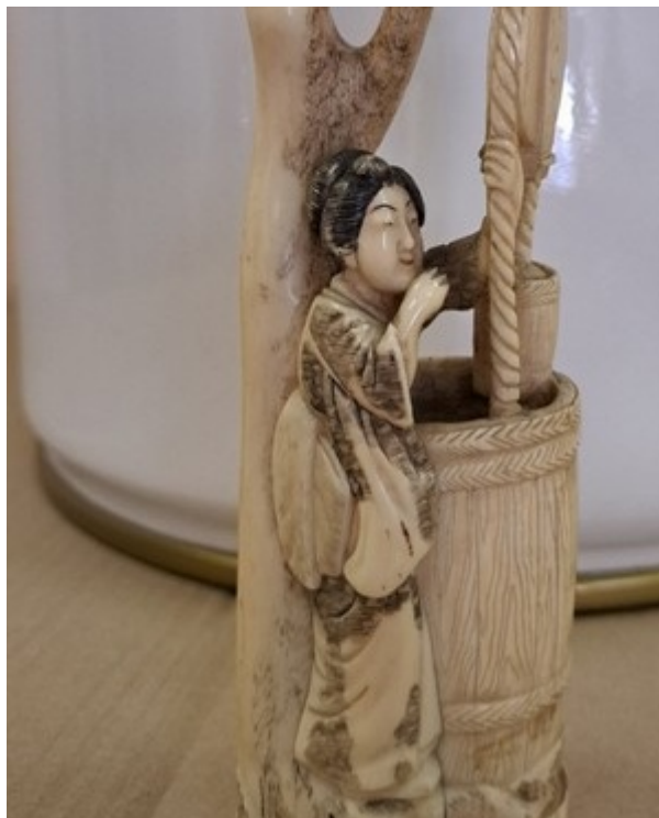
Statuette en ivoire d'éléphant