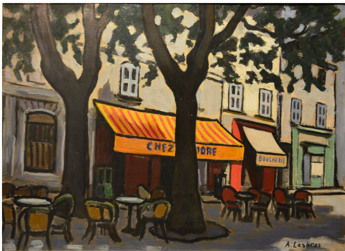
Les Corps Saints à Avignon