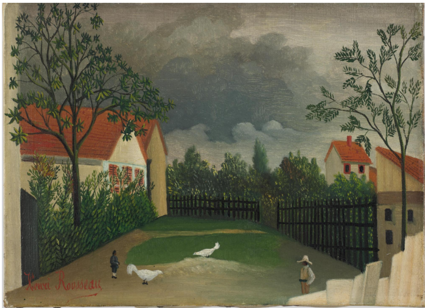
La Basse-cour (huile sur toile, 24,6 x 32,9, [1896-1898]), conservée au Musée national d'art moderne-Centre Pompidou