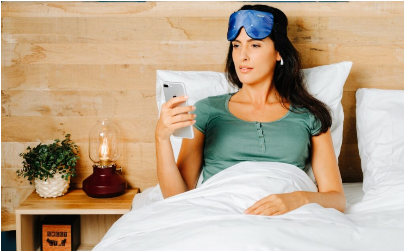
Masque et appli Hypnos