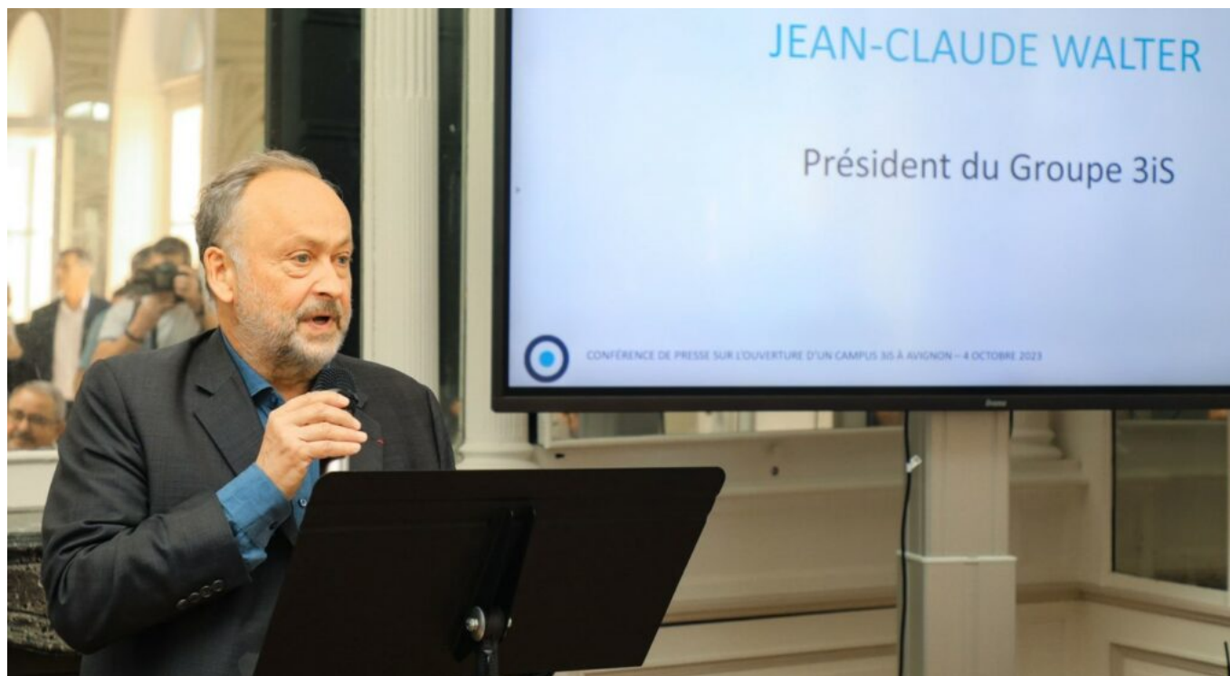
Le président de 3iS.