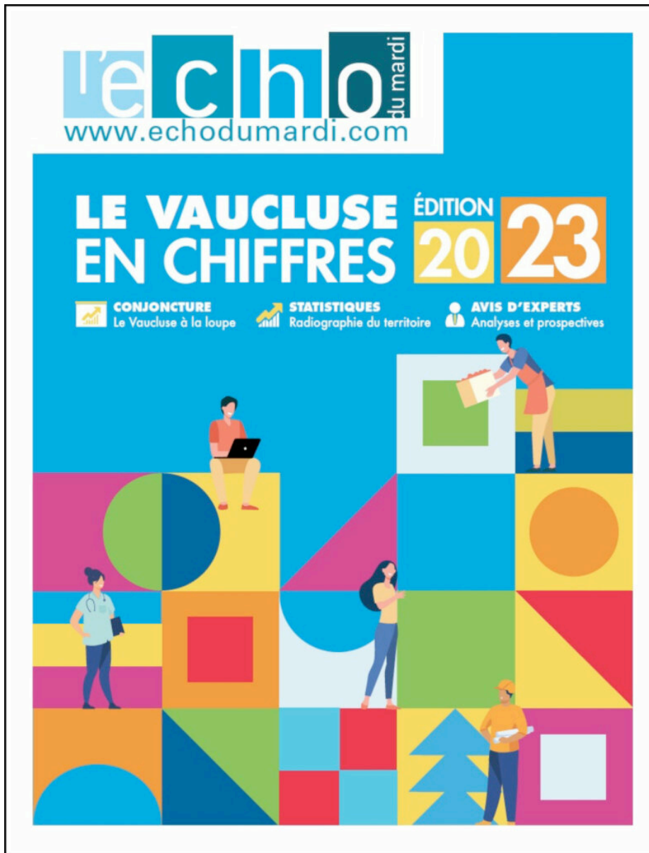
Le "Vaucluse en chiffres- Edition 2023" réalisé par L'Echo du mardi