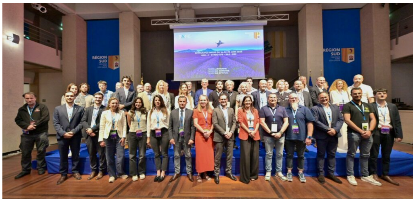
L'ensemble de la délégation des 36 exposants régionaux ayant pris possession du pavillon de la Région SUD.