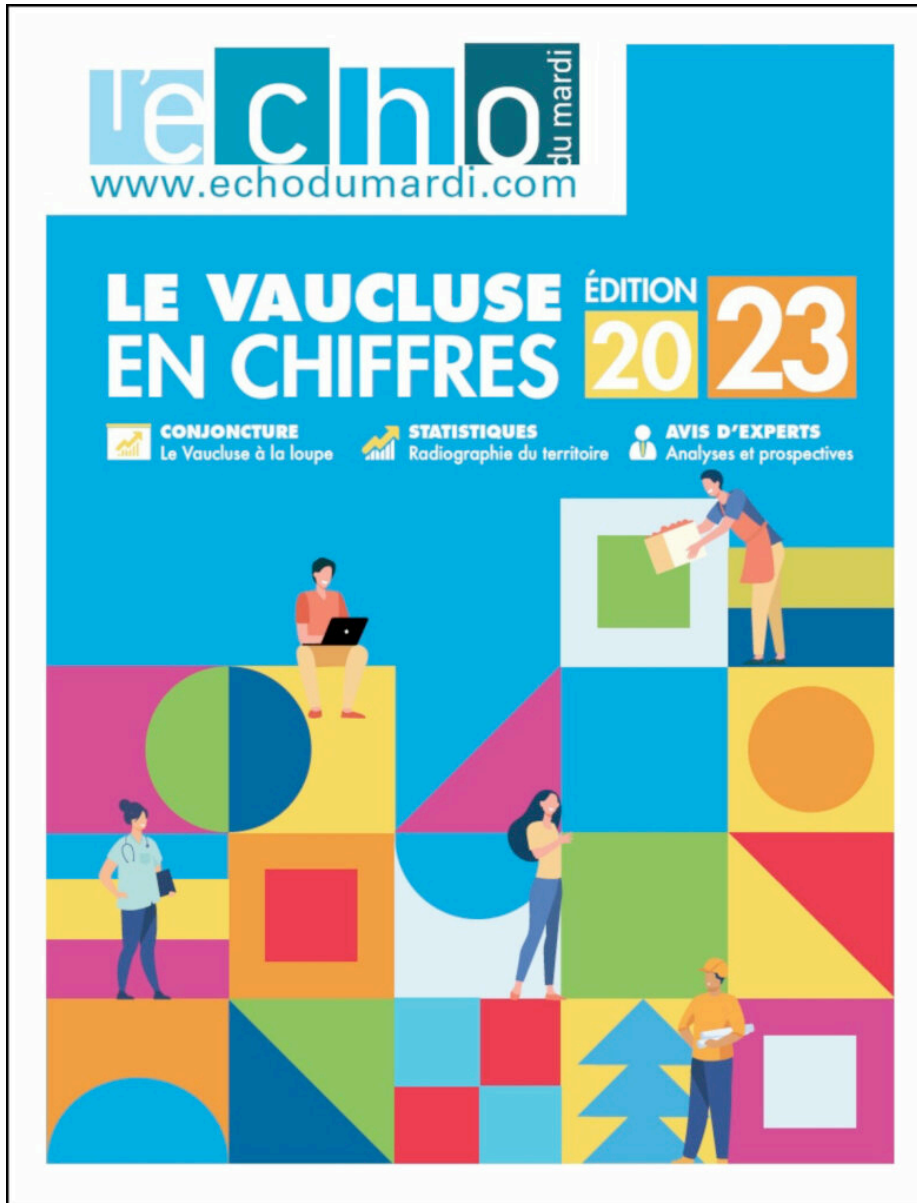
Le "Vaucluse en chiffres- Edition 2023" réalisé par L'Echo du mardi