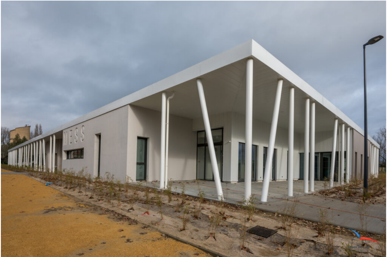
Le nouveau mess de la BA115 est en cours d'achèvement.