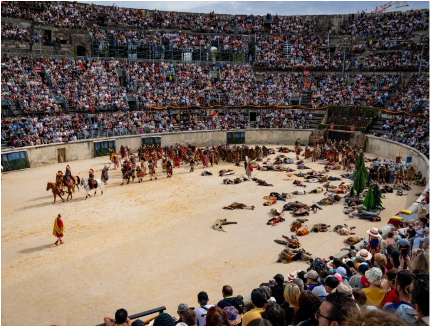
Les arènes de Nîmes