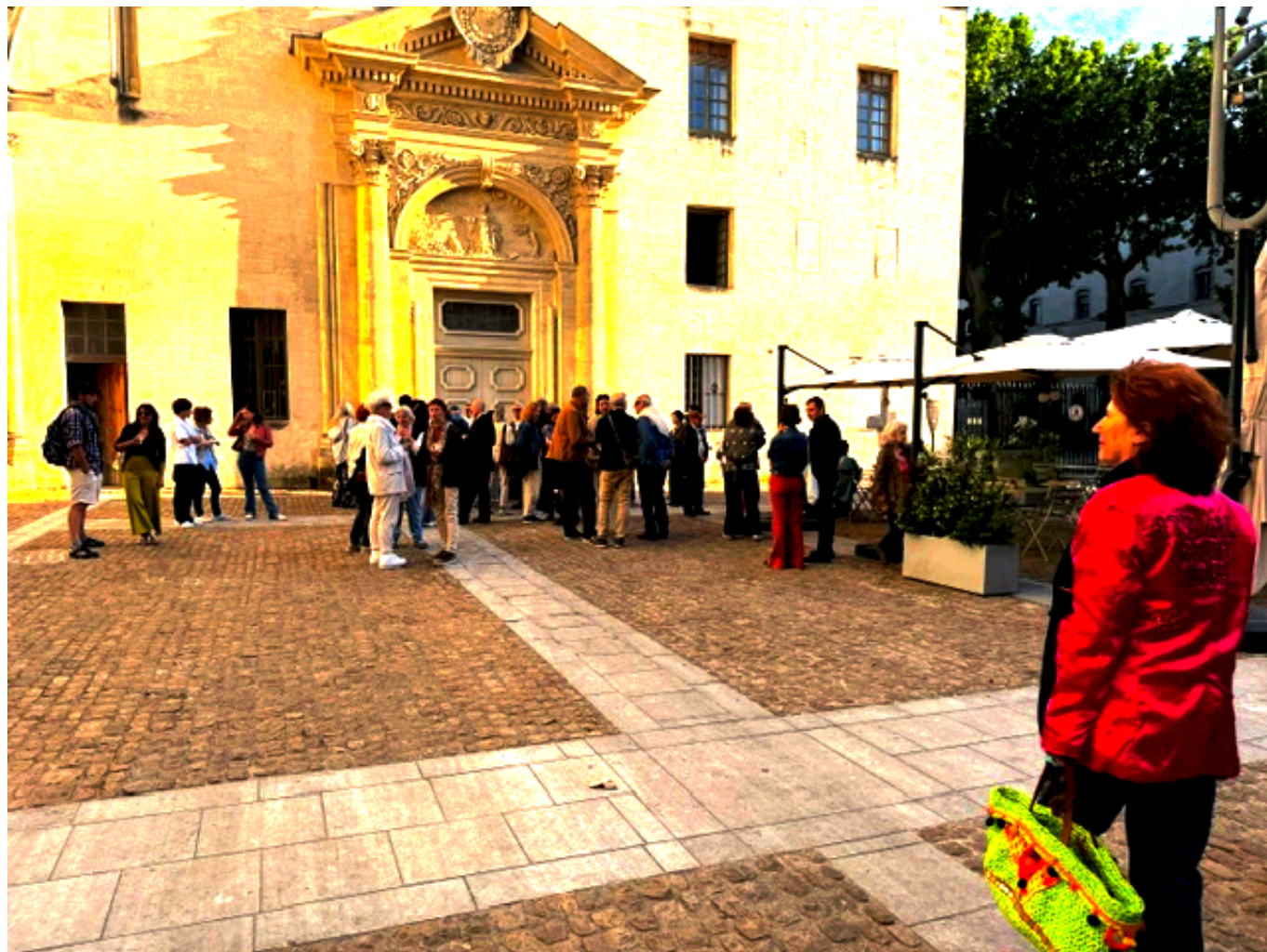
L'église des Célestins, lieu de l'exposition