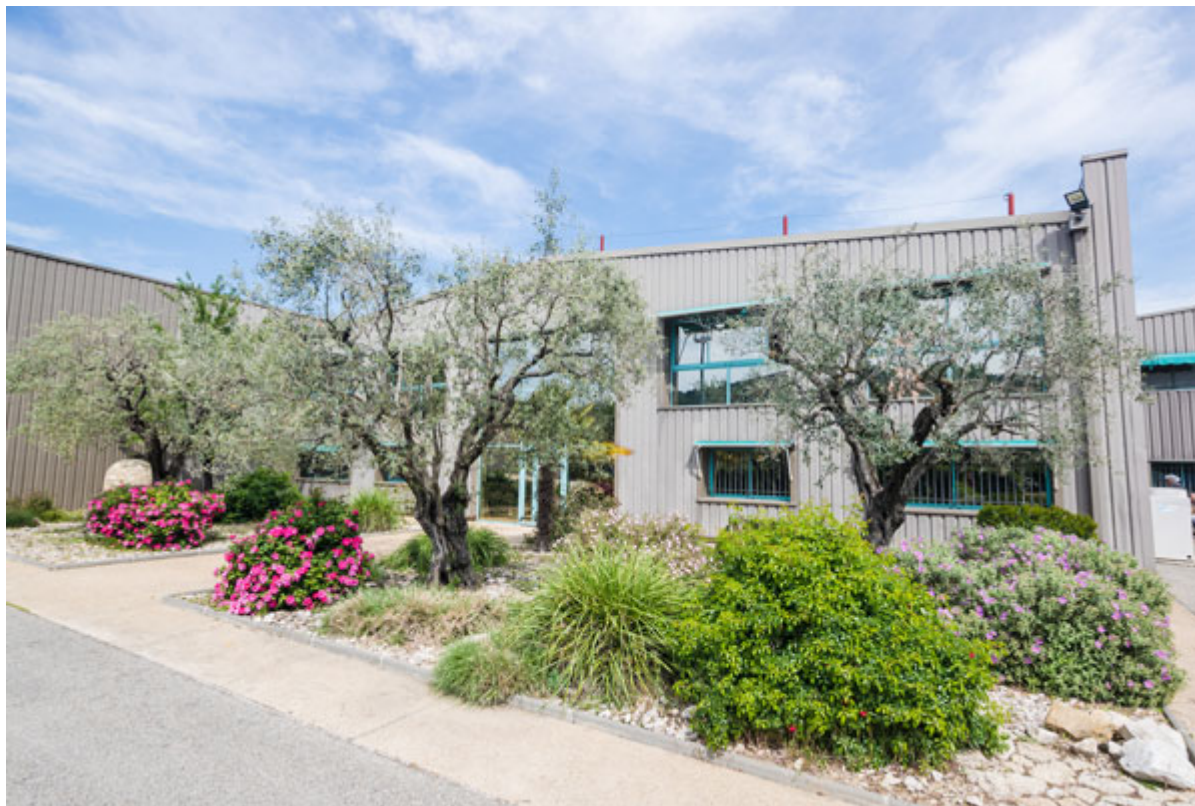
Le site de Vaison.