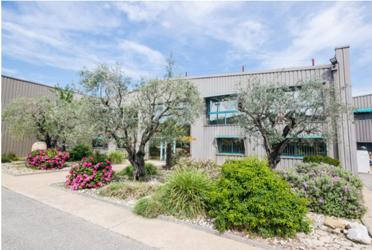
Le site de Vaison.