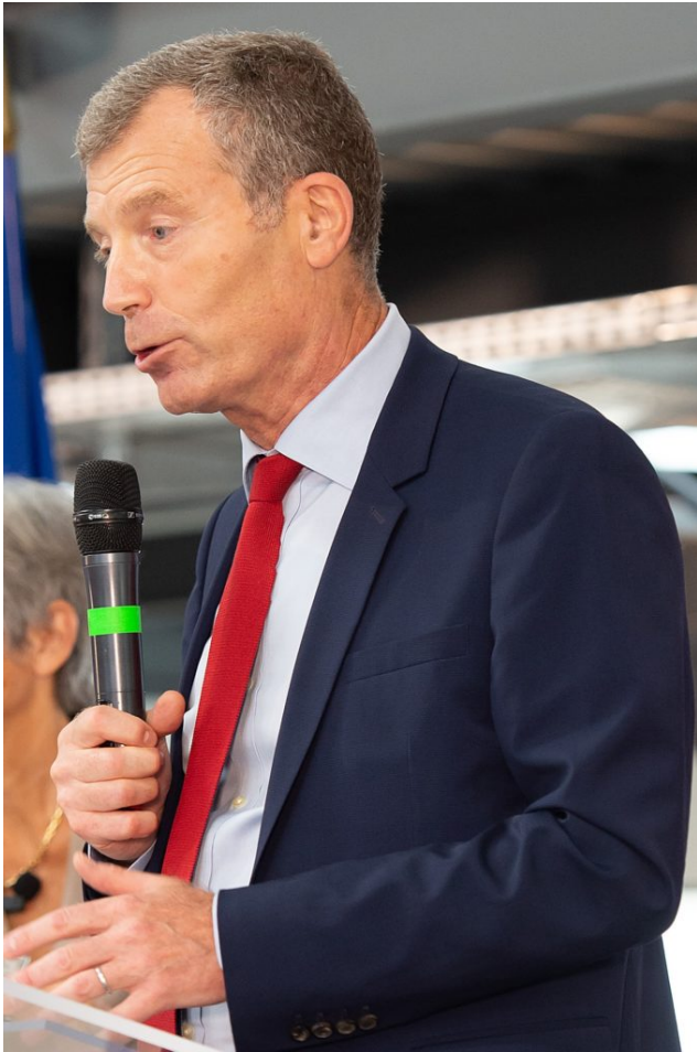
Christophe Mirmand, préfet de Région.