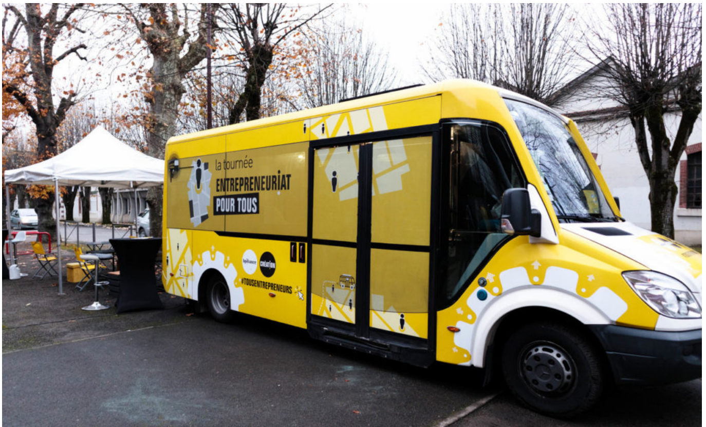
Le bus de l'entrepreneuriat.

A noter que LMV fait aussi partie des recruteurs puisque plusieurs postes sont à pourvoir dans le Pôle petite enfance, notamment avec l'ouverture en janvier prochain d'un nouvel établissement d'accueil du jeune enfant (EAJE) à Cavaillon. Le service de l'urbanisme aussi recherche des instructeurs du droit des sols. Le service collecte recherche également régulièrement des agents pour des missions de remplacement.