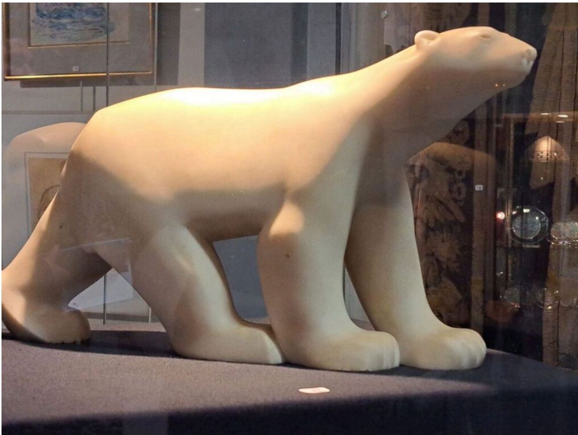
Ours Blanc de François Pompon