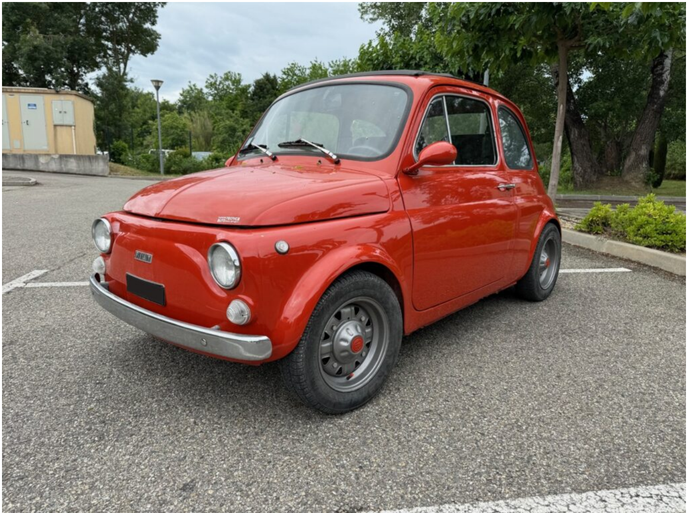
Fiat 500 (1973)