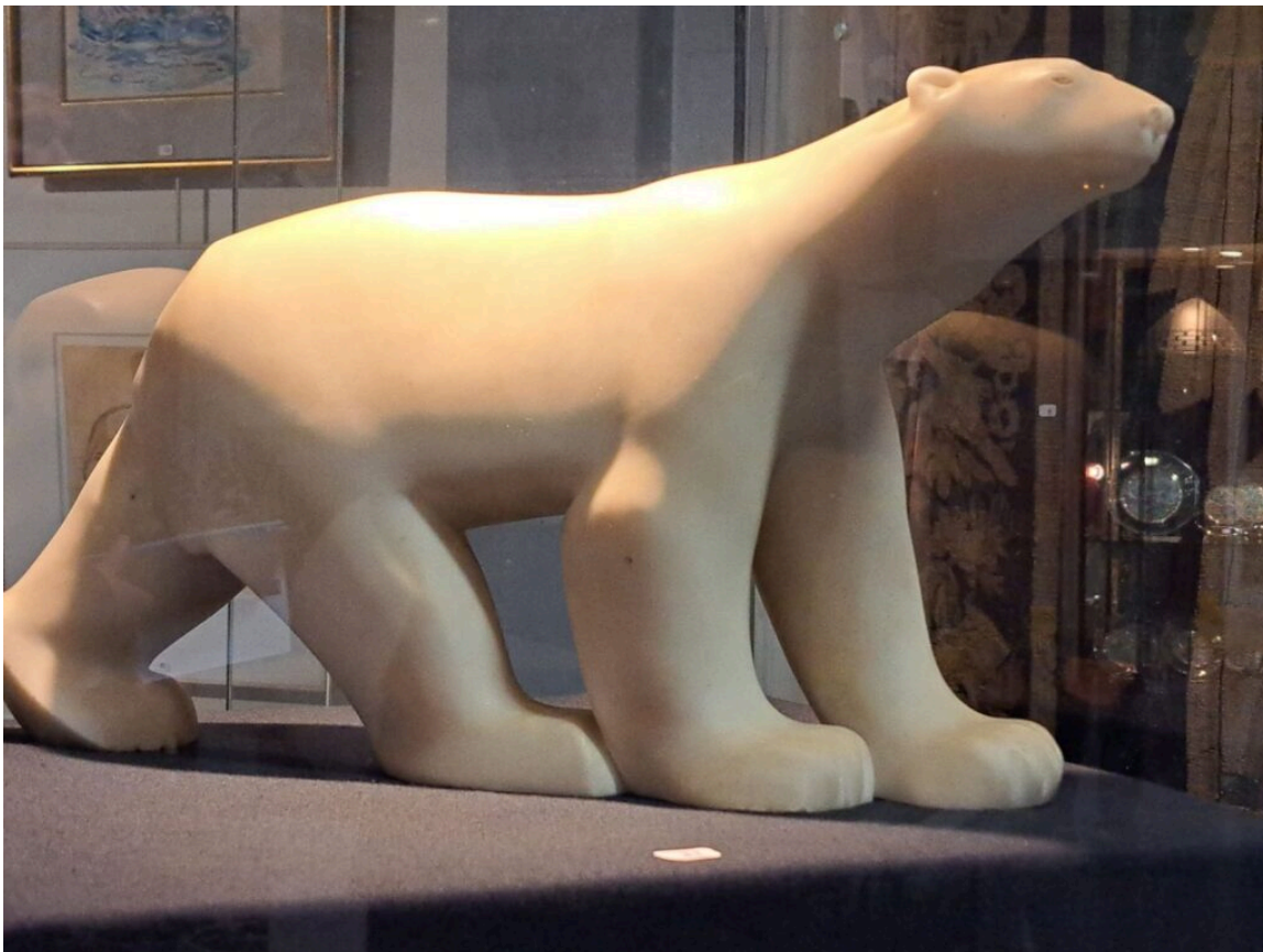
Ours Blanc de François Pompon