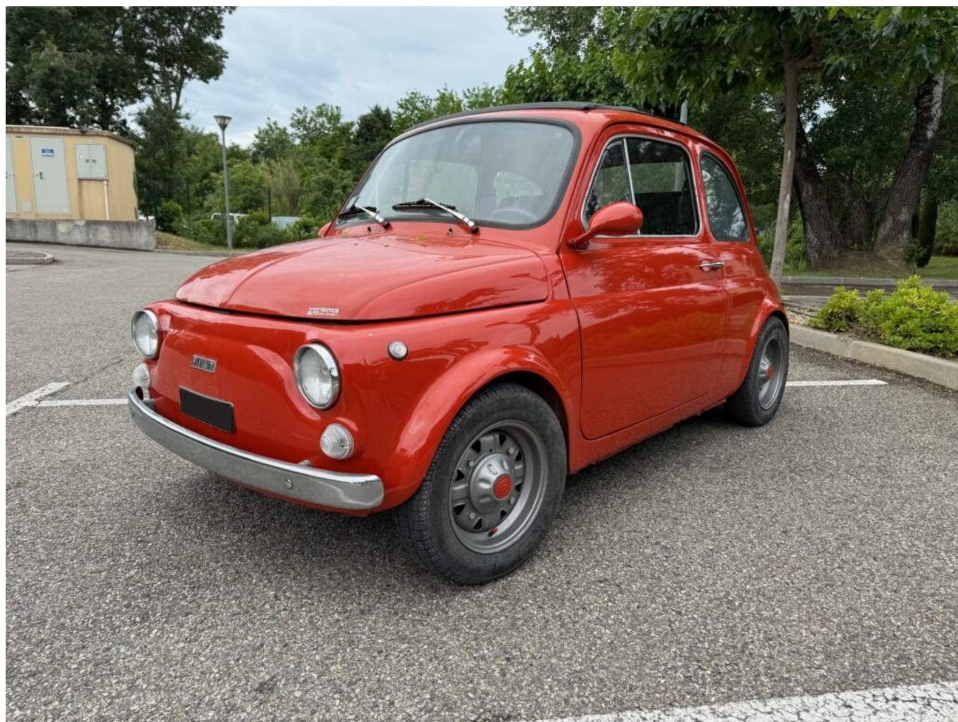
Fiat 500 (1973)