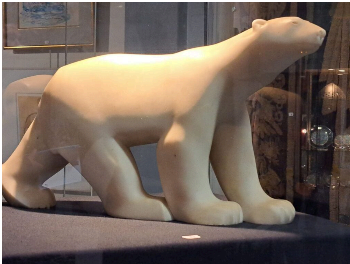
Ours Blanc de François Pompon