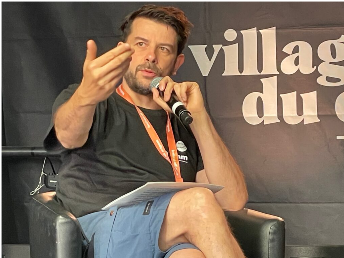
Laurent Domingos Copyright MMH

Pour les deux présidents et la vice-présidente, le Festival off a démarré très fort, peut-être parce que les deux festivals -In et Off- sont organisés aux mêmes dates.