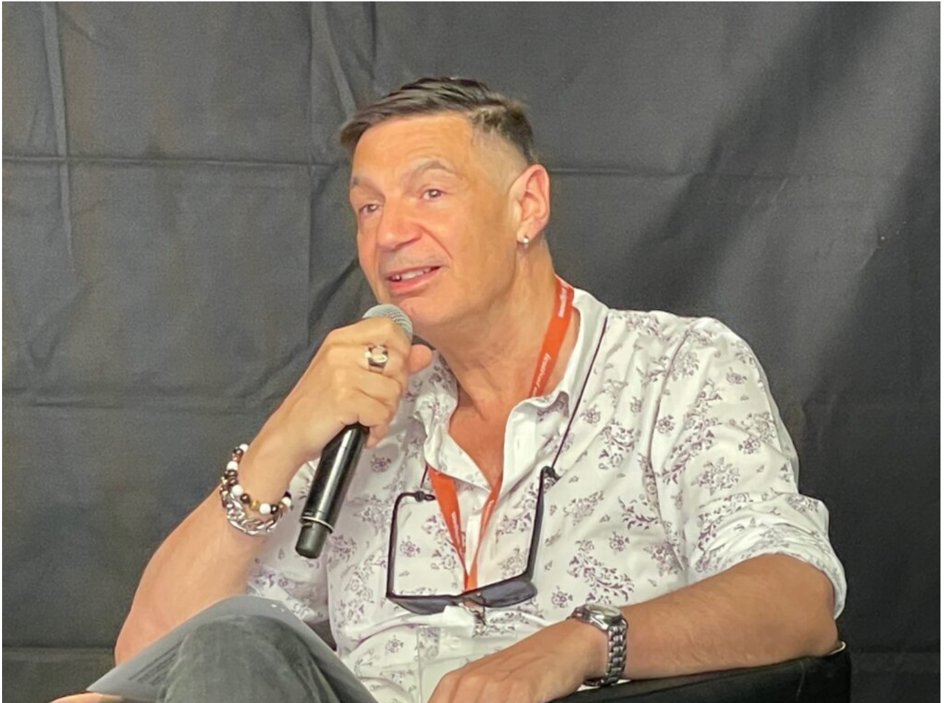
Harold David Copyright MMH