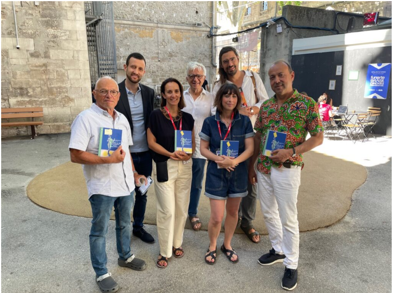
Les auteurs de l'ouvrage Le Souffle du Off sur Avignon Copyright MMH