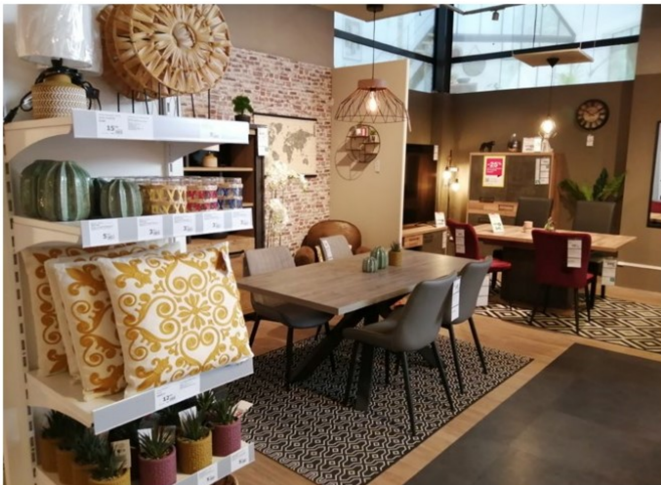
Salle à manger, les rayons font place aux corners déco