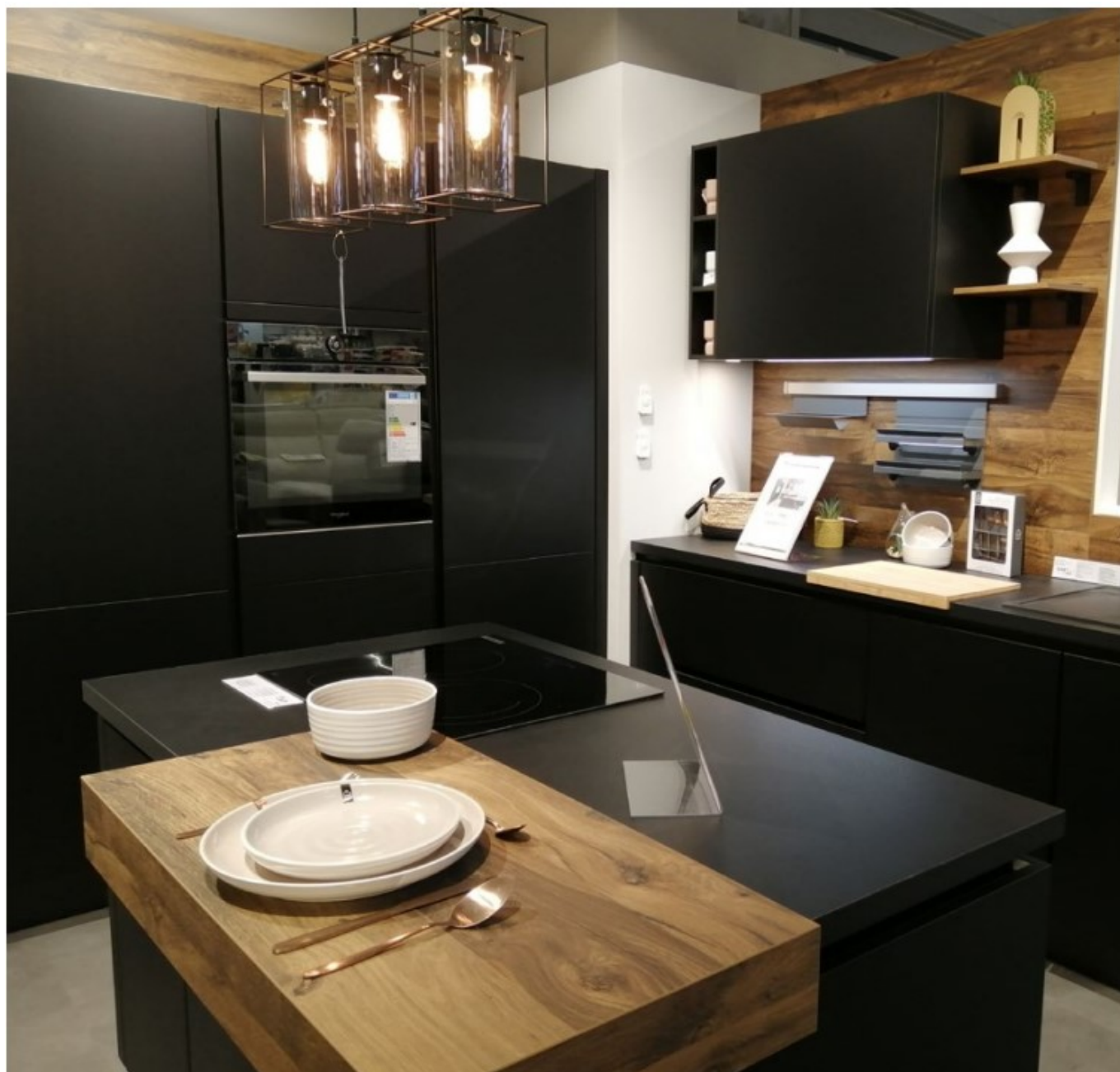
La cuisine selon But