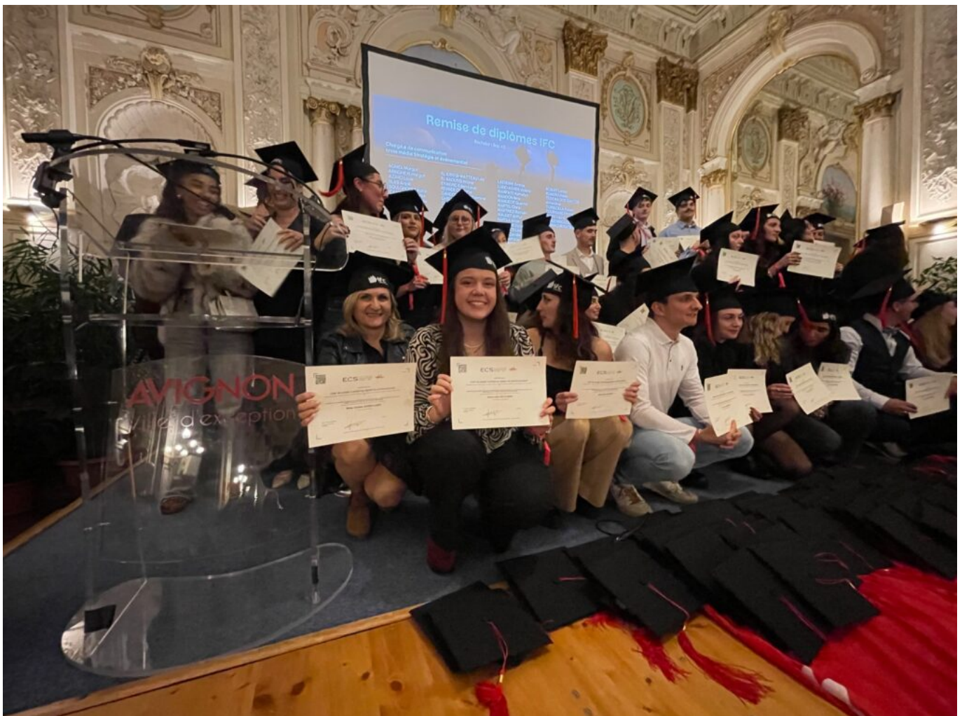
Remise de diplômes IFC

Si IFC est aujourd'hui un groupe, sa culture reste profondément avignonnaise. Dans la cité des papes, il est rare de ne pas croiser quelqu'un qui y a étudié, y a travaillé ou y a inscrit un enfant. Près de 30% des salariés sont d'anciens étudiants ; beaucoup reviennent comme formateurs, tuteurs d'alternants ou recruteurs. Le bouche-à-oreille joue à plein dans un bassin de vie décrit par Mathieu Dupressoir comme « un grand village où la réputation se construit sur la durée ».