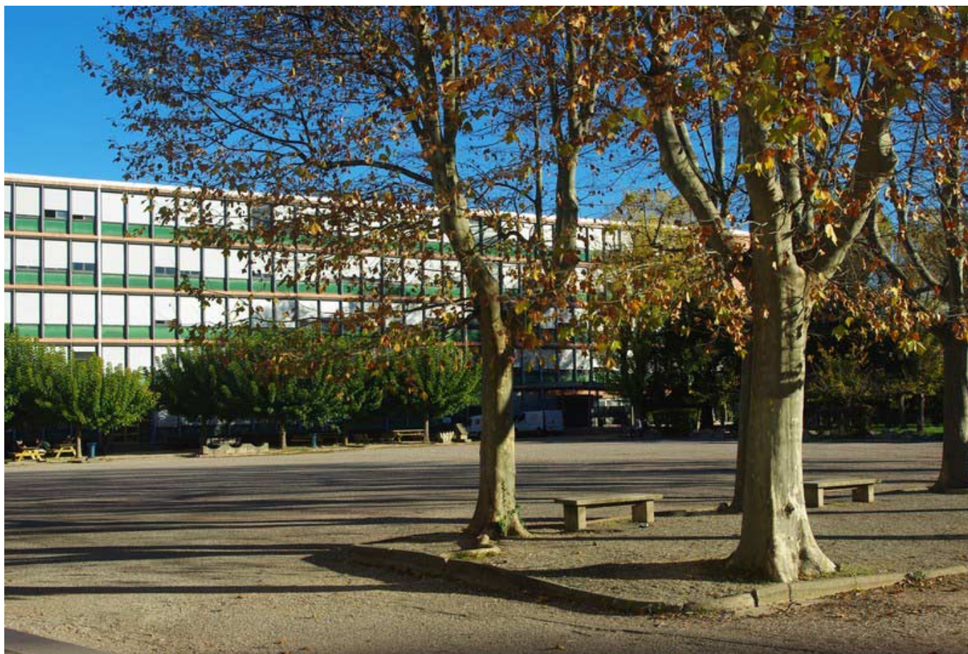
Le lycée Philippe de Girard à Avignon.

Par ailleurs 11,7M€ seront dédiés à la reconstruction des 2 ateliers d'électrotechnique & réhabilitation des locaux d'accompagnement du pôle électrotechnique et construction des locaux EMAT. Des ateliers provisoires seront installés durant l'été 2025, permettant la restructuration et l'extension de ce secteur. Enfin, 1,5M€ financeront la mise en sûreté et rénovation du SSI en SSI/SSS (système de sécurité incendie/système de sonorisation de sécurité).