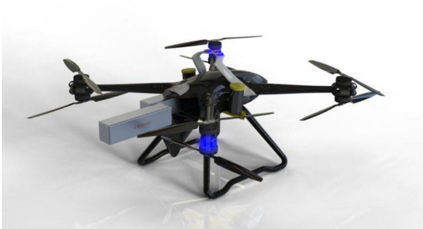
Le BLR014, drone gros porteur en kit, dernier-né de BLR Aviation

Concernant le prototype informatique de voiture volante développée par BLR Aviation , il pourrait transporter deux personnes, ou jusqu'à 250 kg de charge utile, avec une masse maximale de 550 kg. Composé de quatre bras équipés de deux moteurs monopales chacun, ces derniers se déploient pour permettre à la voiture de décoller.