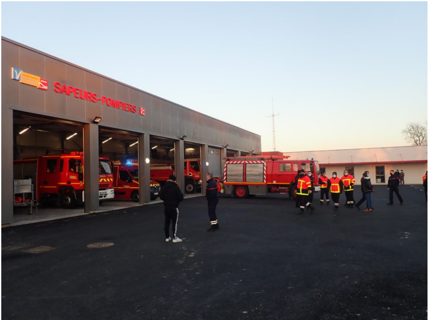
La nouvelle caserne des pompiers se situe à Entraigues.