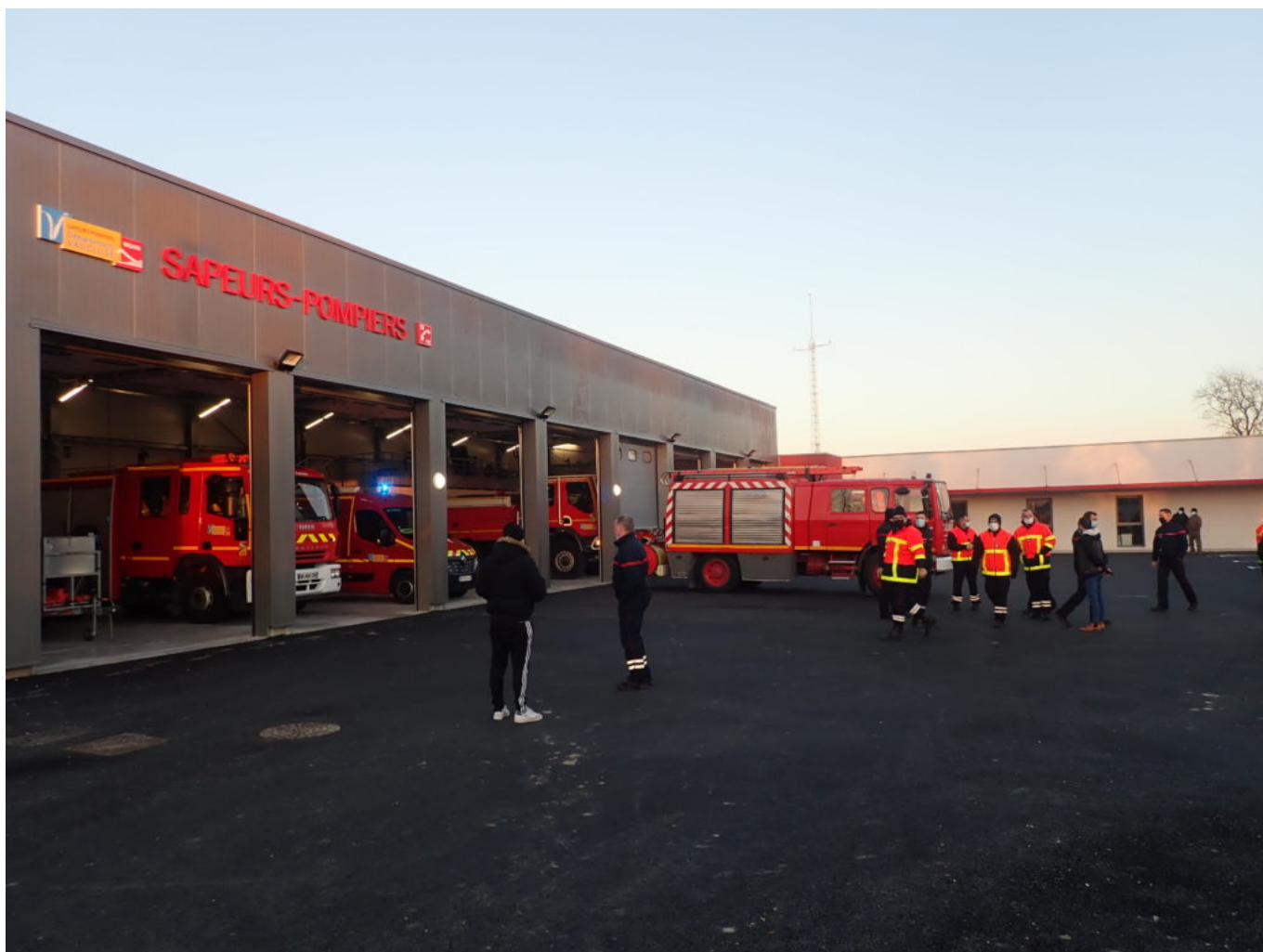
La nouvelle caserne des pompiers se situe à Entraigues.

Après une photo souvenir en présence des élus de la commune, les pompiers ont défilé dans le village au son des sirènes pour un au revoir retentissant. Ils ont ensuite rejoint leurs homologues Entraiguois à la nouvelle caserne où chacun a pu prendre ses quartiers. « Bien que nos pompiers soient désormais basés à quelques kilomètres du centre-ville d'Althen, cela ne changera en rien leur engagement aux services de la population », conclue la municipalité d'Althen-des-Paluds.