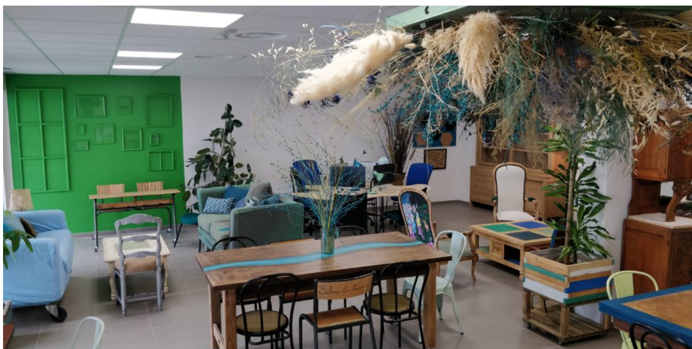
La Maison partagée pour 'faire société' de 7 à 77 ans et plus...