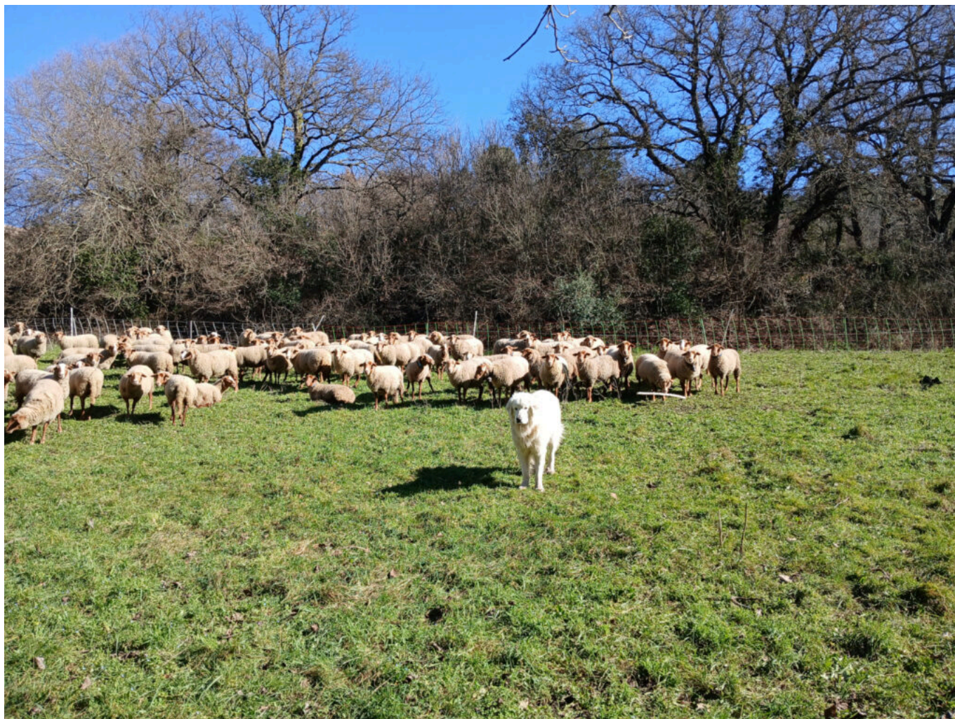
Chien de protection, le patou et un troupeau de brebis

À Caromb, la tombée du jour devient un théâtre noir et silencieux. Longtemps entourée de croyances obscures, la chauve-souris continue de nourrir fantasmes et peurs irrationnelles. Pourtant, derrière son vol imprévisible se cache l'un des mammifères les plus précieux de nos écosystèmes. Lors de la sortie « Chauve qui peut ! », proposée avec le Naturopère , les participants sont invités à dépasser les légendes pour découvrir l'animal avec sa morphologie étonnante, sa navigation par ultrasons, sa fragilité, aussi, face aux bouleversements environnementaux. Puis vient le moment où la lumière baisse réellement. Lampe torche en main et détecteur d'ultrasons à l'oreille, chacun s'avance dans l'obscurité avec cette sensation d'entrer dans un territoire qui appartient à un autre monde. Le Ventoux révèle alors son visage nocturne, discret fourmillant de vie. Chauve qui peut ! Caromb, vendredi 22 mai de 20h à 22h. Prévoir son pique-nique.