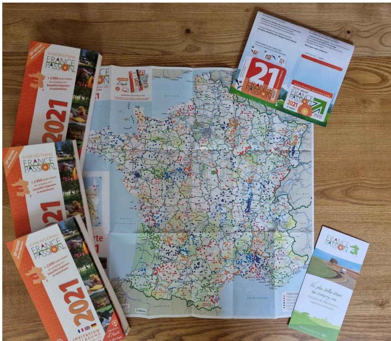
Les livrets France Passion.

« Je suis étonnées, depuis que j'ai réalisé un peu de publicité via les réseaux sociaux, je reçois énormément de demandes de renseignement ou de réservations pour l'Ascension. Une personne est déjà intéressée pour un 'road trip' de trois semaines. Des personnes de Bédoin et d'ailleurs m'ont également contactée ». Une aubaine pour la chef d'entreprise dont les projets de développement fourmillent déjà.