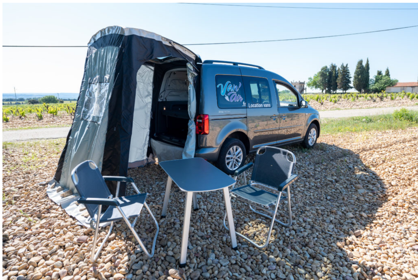
Le Caddy Beach avec une tente de hayon.