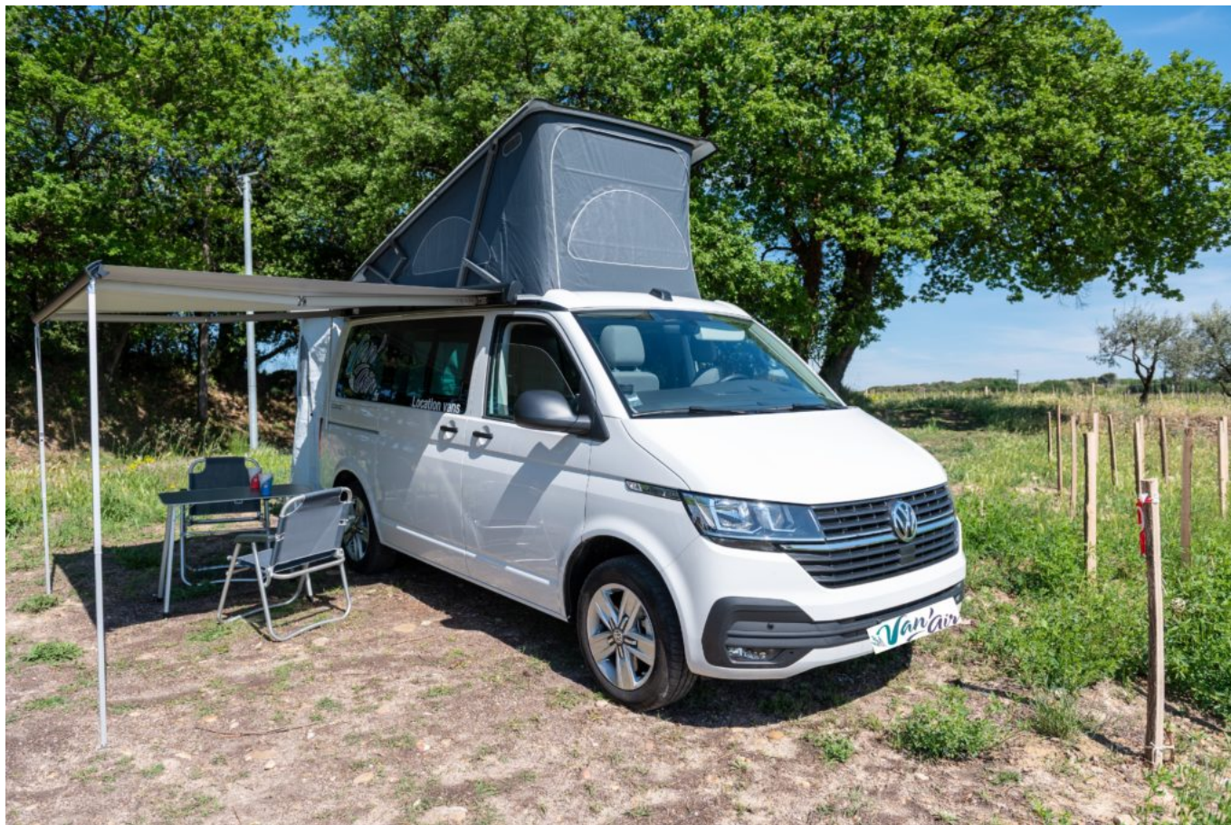
Le 'California' avec le toit relevable.

Autre véhicule du parc, le 'caddy beach' de 5 places propose deux couchages avec un matelas dépliant, stocké dans le coffre. Le véhicule est équipé d'une tente hayon. Cet auvent se monte en un rien de temps, inutile de vous procurer des arceaux, les campeurs expérimentés n'auront rien à vous envier. Avantage supplémentaire, vous disposez désormais d'une entrée couverte. Par mauvais temps, vous pouvez laisser vos vêtements sécher dans la tente et entrer propre et sec dans le van. Vous pouvez transformer votre hayon en une solette spacieuse pour profiter du beau temps ou du soleil qui se couche. A l'intérieur : réchaud, jerrican d'eau potable et tout le nécessaire de cuisine. Un dispositif permettant ainsi de disposer d'une pièce supplémentaire et de prendre une douche en toute intimité.