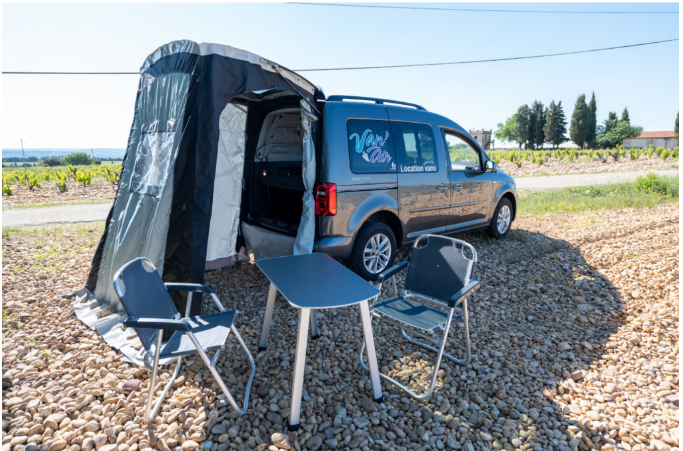
Le Caddy Beach avec une tente de hayon.