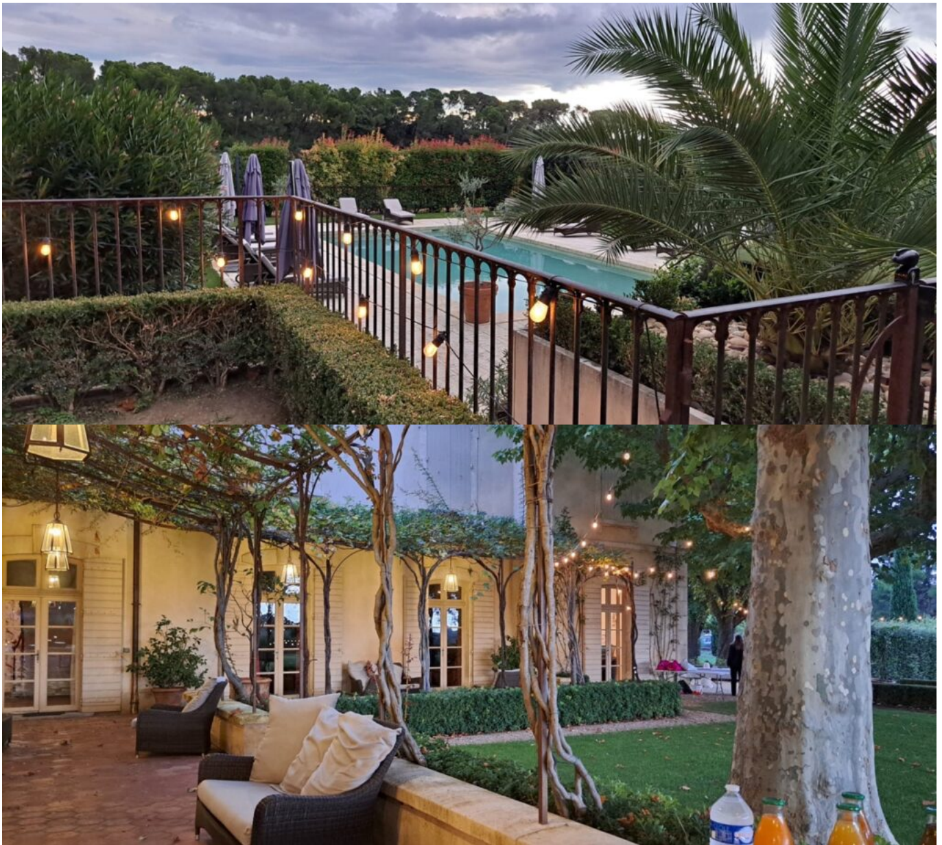
Le Château Gigognan, où s'est déroulée la soirée.