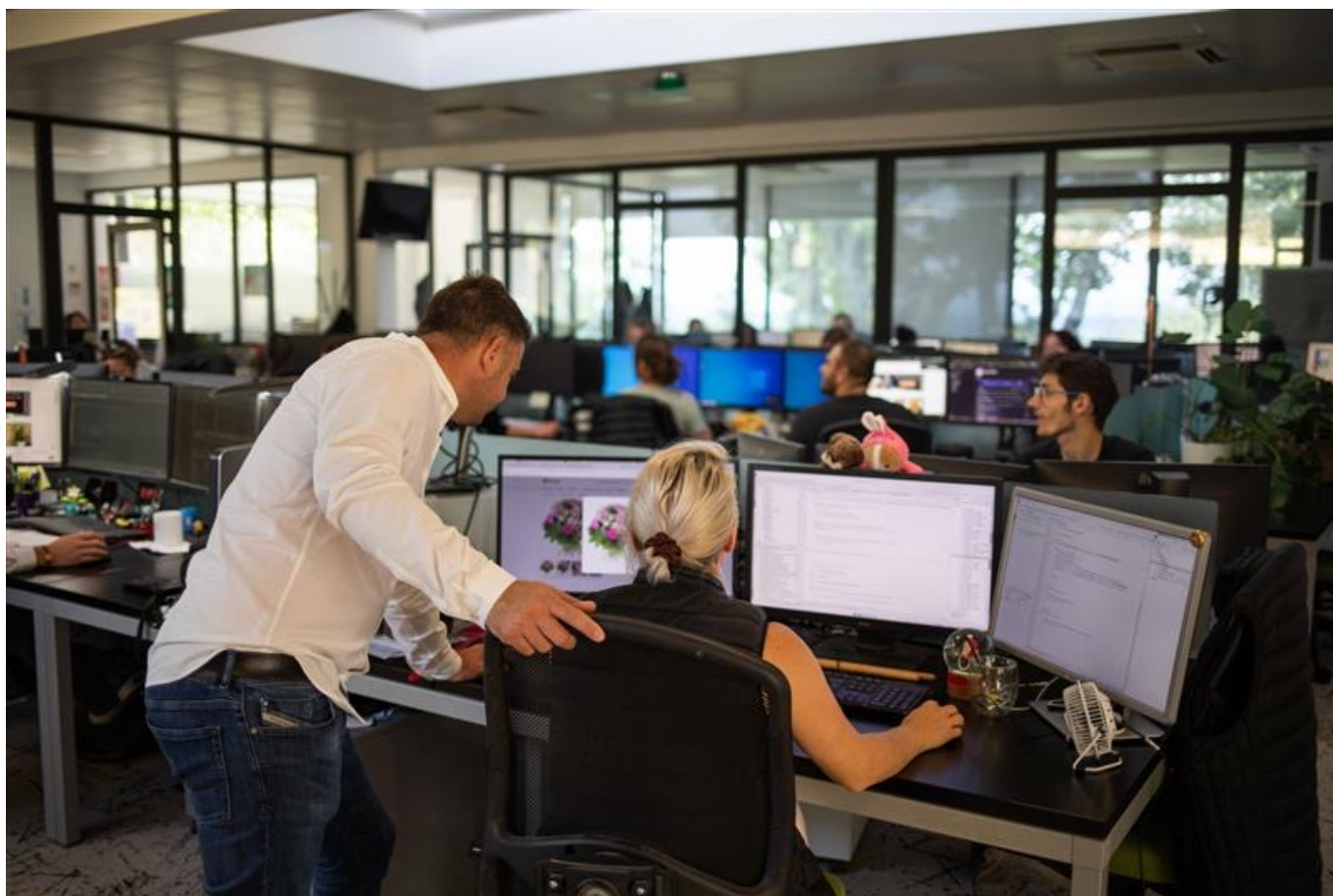
Les locaux de Florajet.com à Cabrières d'Aigues.