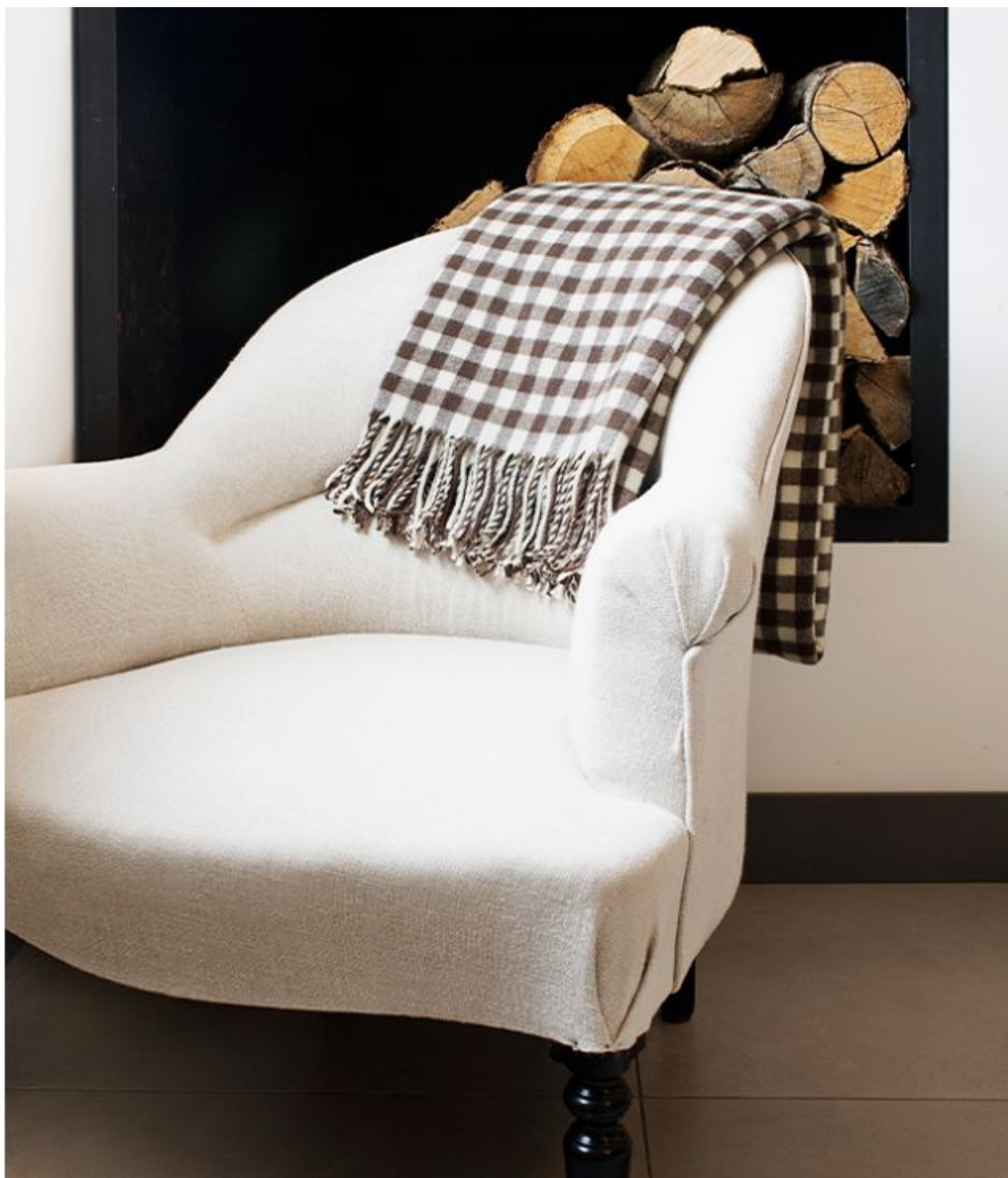
La nouvelle collection 'Arles, entre Camargue et Alpilles'. ©Brun de Vian-Tiran