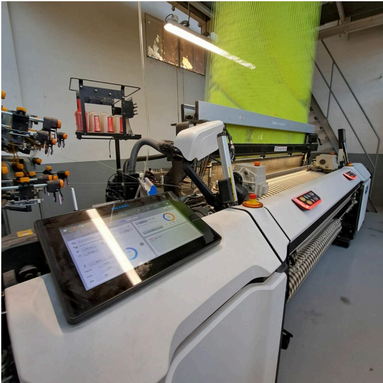
Le nouveau métier à tisser high-tech.