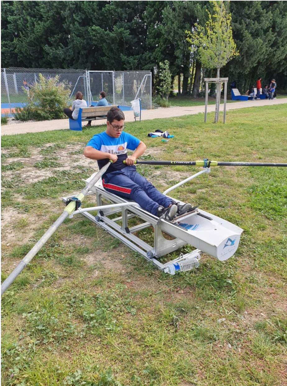
Prototype de bateau solo développé par l'entreprise ATG Technologies