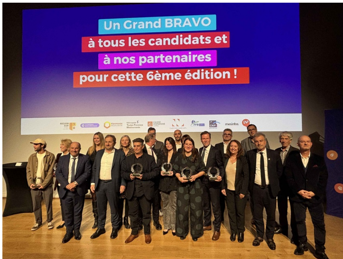
Les lauréats de la 6e édition des Trophées régionaux des entrepreneurs positifs.