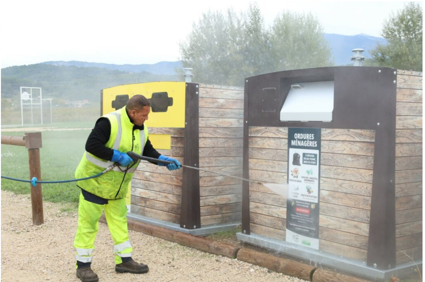
Chaque point de collecte est nettoyé au moins une fois par semaine.