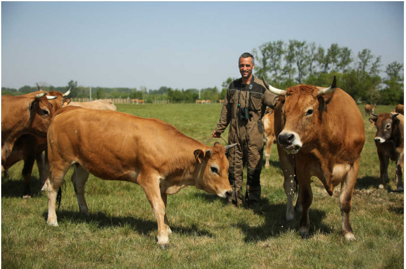
La vache Maraîchine, Association pour la valorisation de la race bovine Maraîchine et des prairies

Les candidats ont jusqu'au 17 janvier 2022 pour déposer leur dossier sur le site internet de la Fondation du patrimoine lien en cliquant ici . Le prix 2022 sera remis mi-mai 2022 à l'occasion de la Journée des races menacées et de la Journée internationale pour la biodiversité.