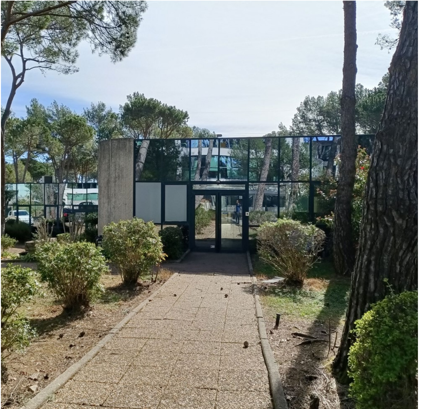
Le site de Sophia-Antipolis.

« L'idée générale, c'est de proposer le plus possible une continuité dans les départements de formation, complète Vincent Belmontet. L'objectif étant d'accompagner au maximum les jeunes dans la poursuite de leurs études afin de les mener vers les étapes les plus hautes dans leur formation. Ainsi, il y a environ