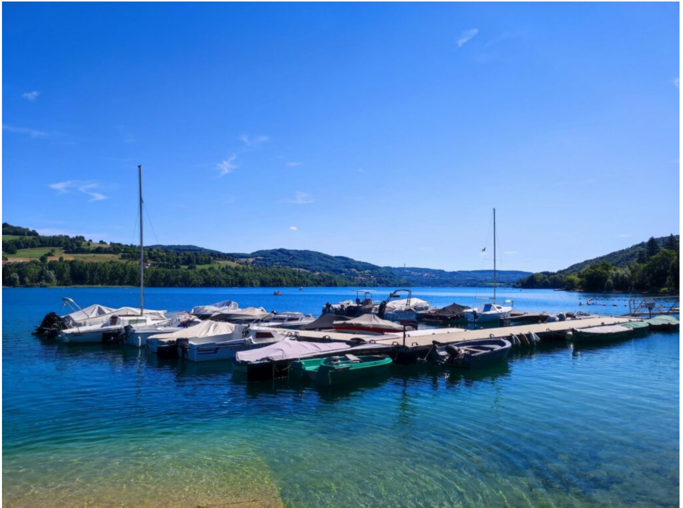
Le lac de Paladru

large partie Sud et Est est aménagée pour la promenade à pied ou à vélo, notamment pour rejoindre les communes de Charavines et de Paladru, en passant par Biliou ou Montferrat. Sur l'eau, les amateurs de navigation trouveront de quoi se divertir à l'école de voile, ou pour les moins téméraires, sur un pédalo.