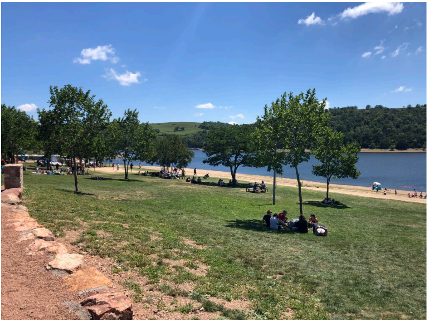
Le lac de Villerest