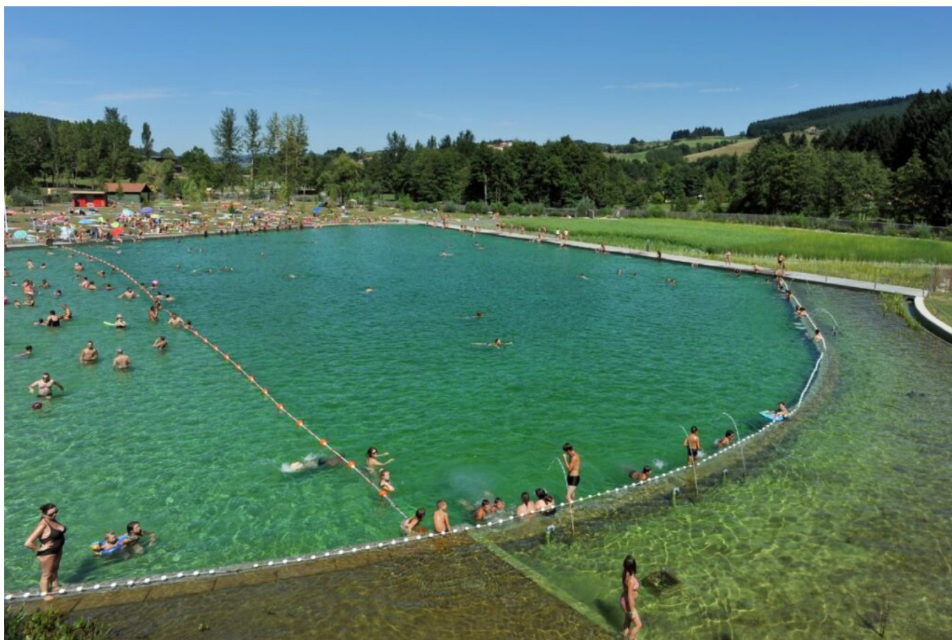
Piscine naturelle au lac des Sapins

Pour les adeptes des parcours aventure, cap sur la Forêt de l'aventure qui propose quatre parcours aventure pour quatre niveaux de difficultés et sept tyroliennes sur le site Lac des Sapins, accessibles à tous. Pour les enfants, les parcours s'effectuent en ligne de vie continue et les adultes ont des mousquetons « intelligents », donc impossible de se détacher avant la fin du parcours. En cas de petite faim, on peut se restaurer sur place ou quitter le site pour Thizy-les-Bourg, à quelques encablures du lac des Sapins. Le New Gambetta propose une cuisine traditionnelle mais raffinée. Derrière une façade relativement anonyme, on passe dans un monde de saveurs et de convivialité. L'été est propice à ce bon moment de table grâce avec une terrasse ombragée. La salle intérieure est tout aussi agréable et on pourra apprécier la qualité des produits et un service rapide et aimable. Notre conseil : la terrine artisanale, le magret de canard et le burger en plats et le tiramisu et le brownie glacé pour les desserts.