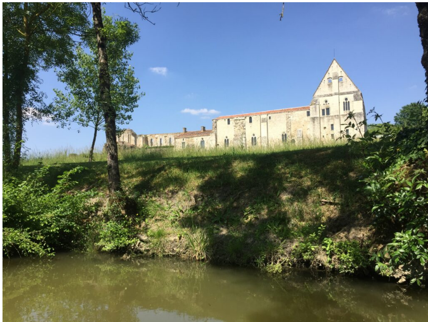
L'abbaye de Maillezais depuis les canaux du Marais poitevin.

De nombreux embarcadères sont répartis dans le marais mouillé offrant autant de points de départs à cette aventure verte et bleue. L'un d'eux est installé au pied de la majestueuse abbaye de Maillezais, élevée sur une île à partir du X e siècle, dominant les canaux du marais creusés par les moines. L'ancienne église abbatiale, convertie en cathédrale Saint-Pierre de Maillezais en 1317, est laissée à l'abandon à partir de 1666 et vendue comme bien national en 1791, détruite pour une grande partie par les marchands de matériaux. Mais de ses vestiges, aujourd'hui figés dans le temps, transpire une histoire millénaire qui touche chaque visiteur.