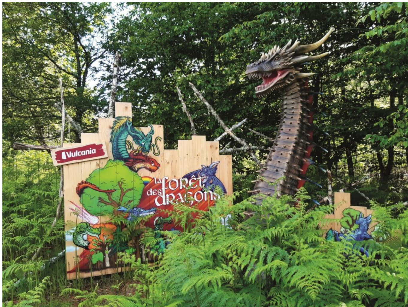
Vulcania, la forêt des dragons

impacts du changement climatique, Vulcania s'intéresse à tous les phénomènes naturels de la planète et aux croyances véhiculées à travers les siècles. En parcourant la Forêt des dragons, huit légendes vous seront ainsi contées.