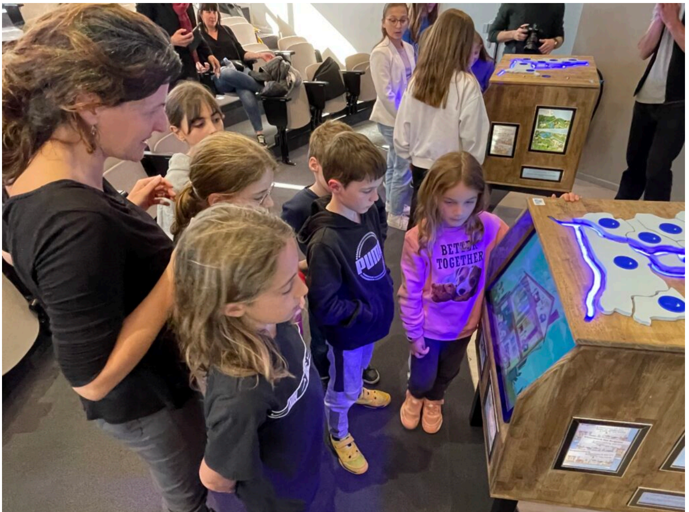
Quand Enigm'O s'installe en classe