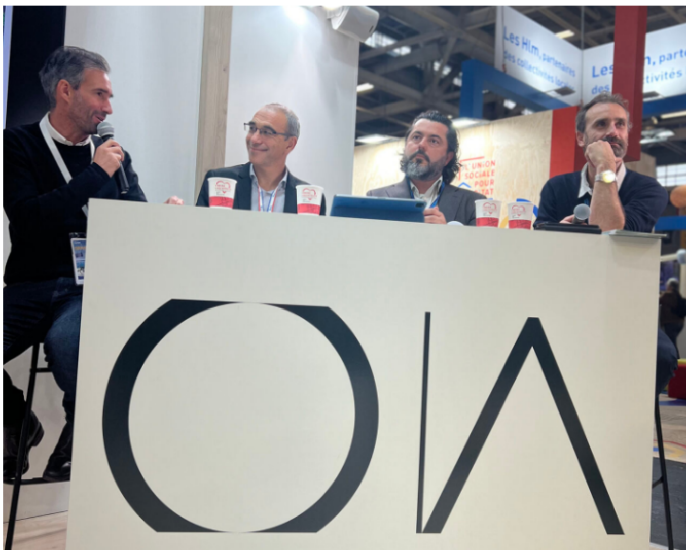
Moment de table ronde sur la construction bois régionale avec la participation de Fisbois Sud