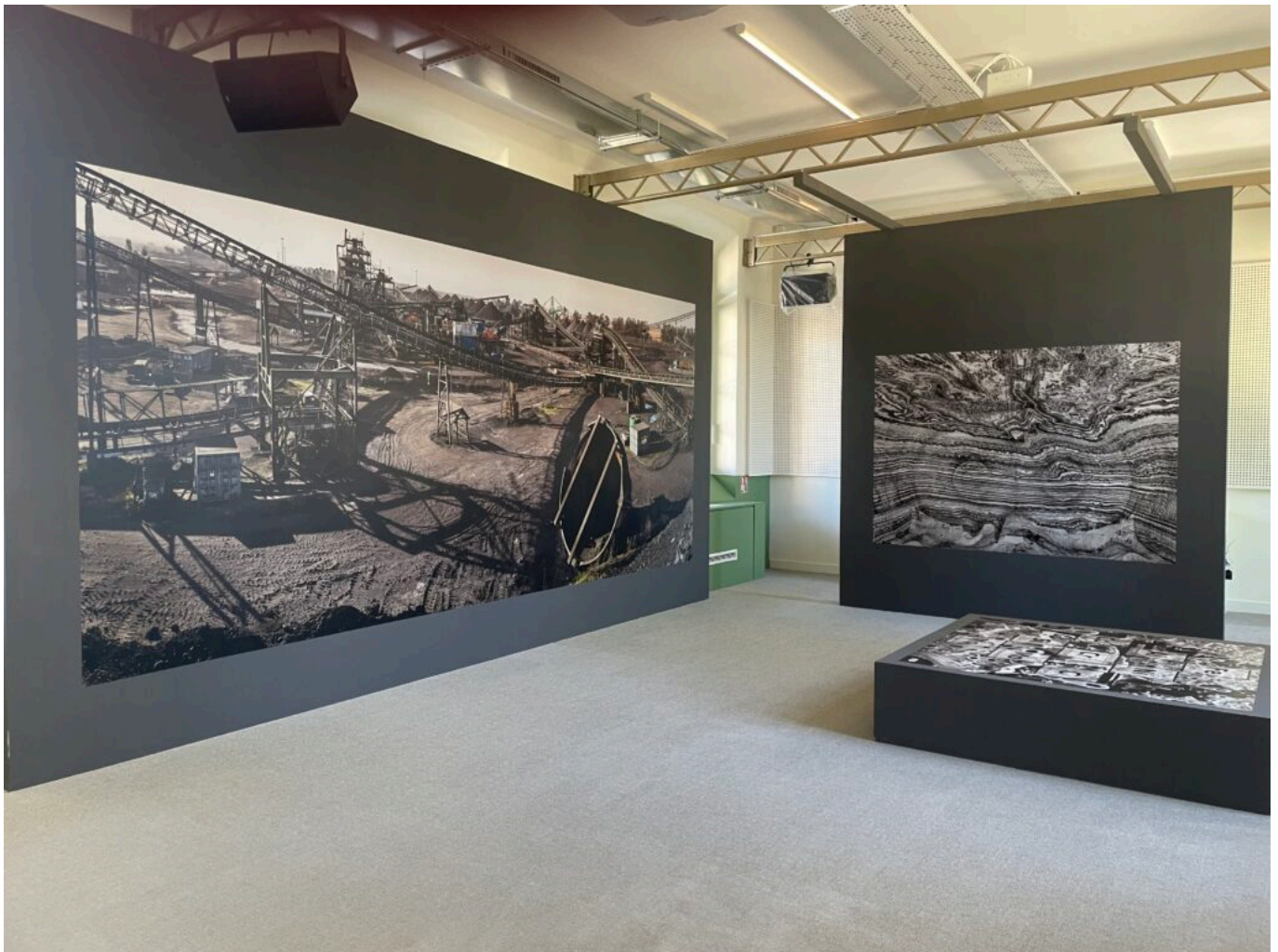
L'exposition d'Edward Burtynsky

La Villa Créative lance chaque semestre, en octobre-novembre et janvier-février, une campagne d'appel à projets : artistes, chercheurs, associations, collectifs, institutions sont invités à candidater. Les Collèges artistiques et scientifiques de la Villa Créative se réunissent à l'issue de l'appel pour étudier chaque candidature et potentiellement l'intégrer à l'écosystème de la Villa Créative - en l'associant à des programmes de recherche, en cours de développement à travers des résidences protéiformes, accueillies dans cet espace hybride. La 1 ère année La Villa créatrice a compté 1 000 consultations de l'appel et réceptionné 120 candidatures. Enfin, La brasserie, écoresponsable, propose l'inclusion, donne à travailler et servir des produits locaux, équitables, provenant de circuits courts et à bas coûts carbone. C'est aussi un restaurant d'application.