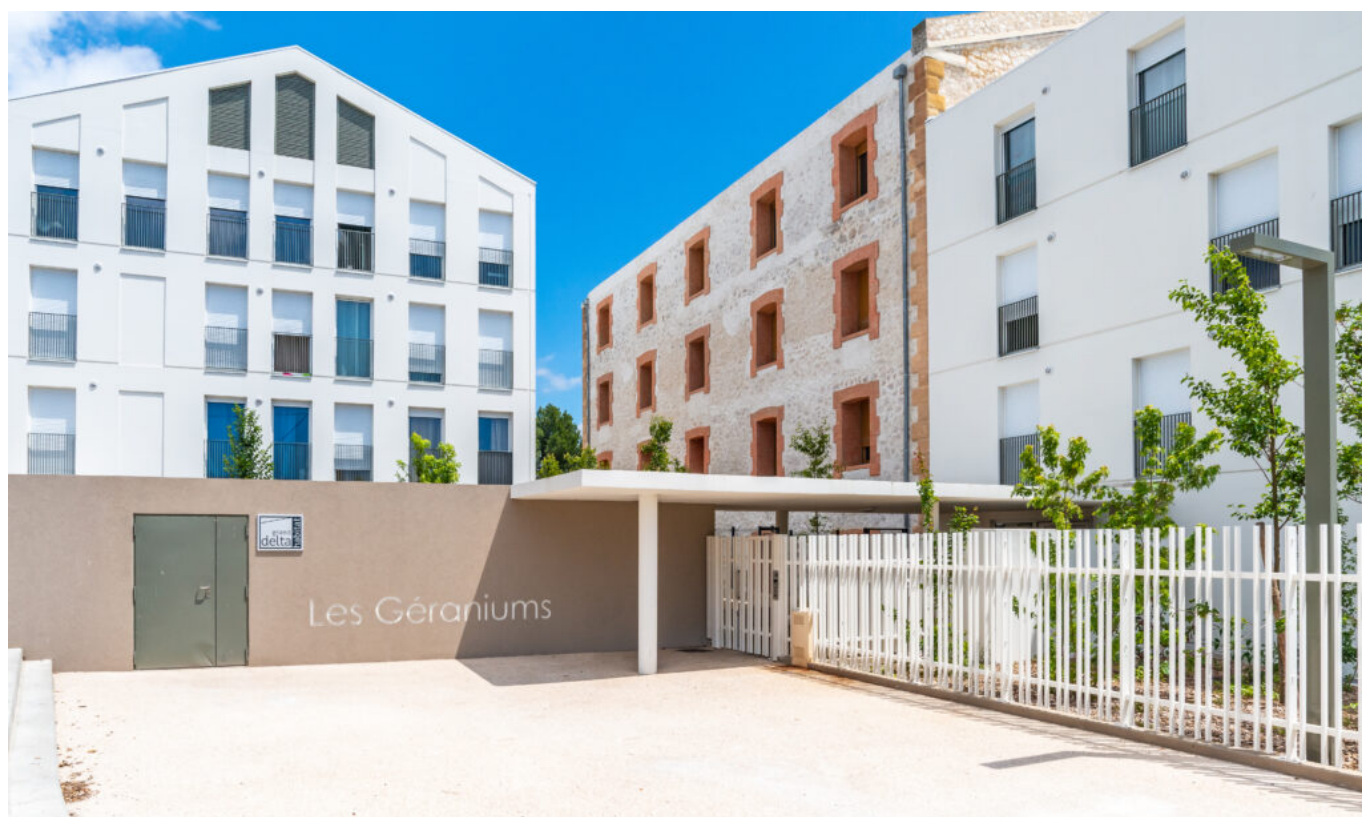
Les Gêraniums