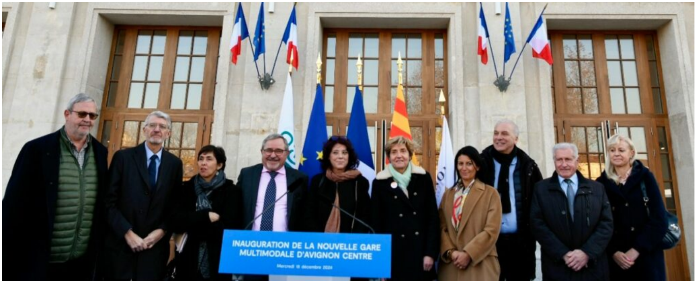
Les élus lors de l'inauguration.

« Il était important que nous nous mettions tous d'accord sur l'ambition que nous souhaitons donner à ce projet, confirme la maire d'Avignon. Notamment par l'ambition de connexion des différents modes de transport en repositionnant le train au cœur du dispositif. Car notre conviction, c'est que le train est une solution alternative au transport du quotidien pour les habitants d'Avignon, mais bien au-delà, pour les habitants du bassin de vie. »