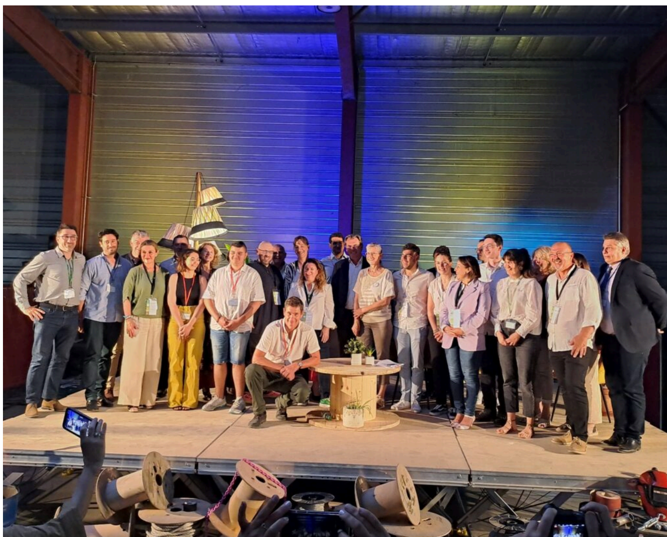
Les intervenants et animateurs de la soirée.