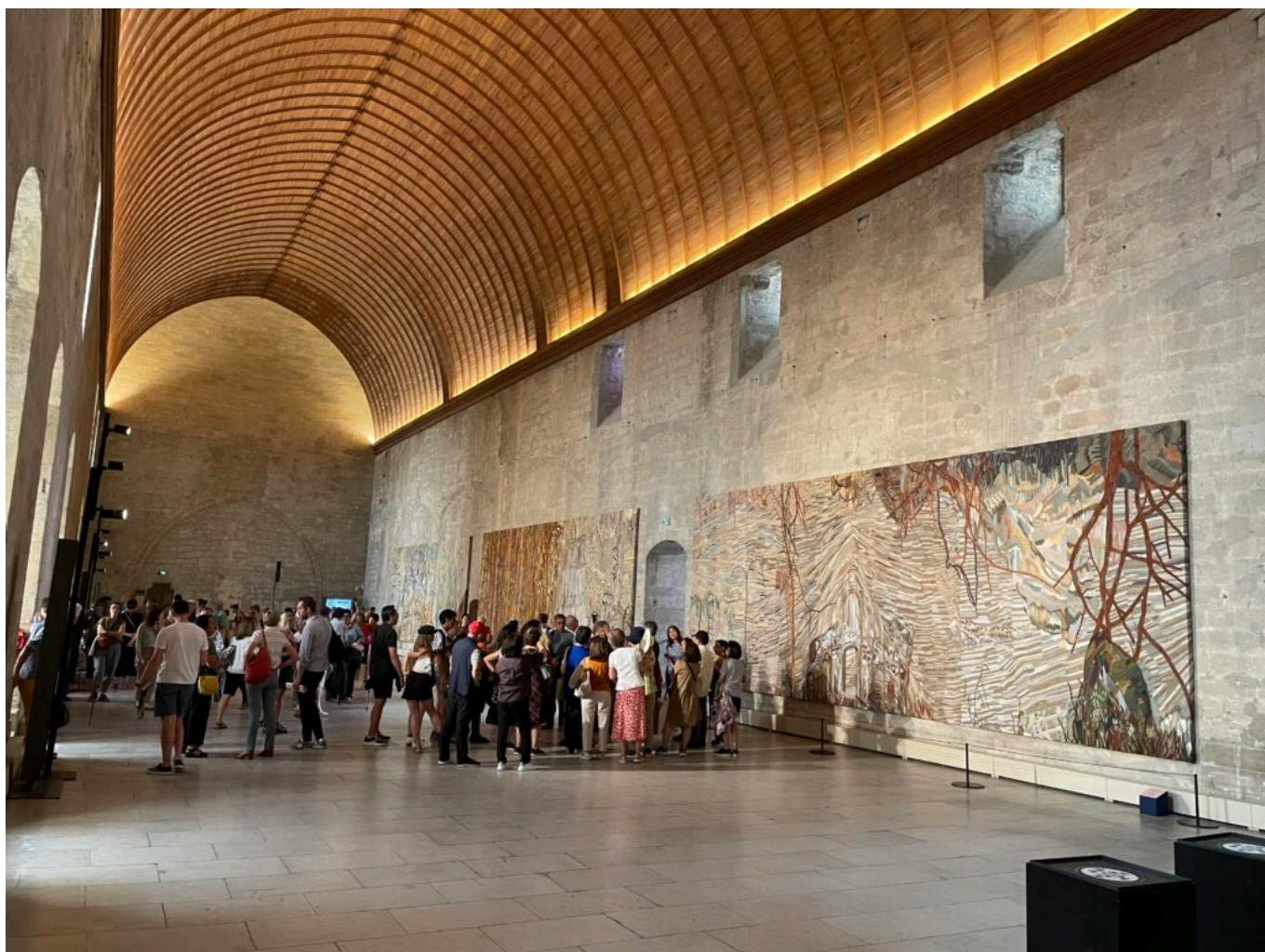
Chambre de soie , broderie de fils de soie réalisées pour le défilé Dior Automne Hiver 2021-22